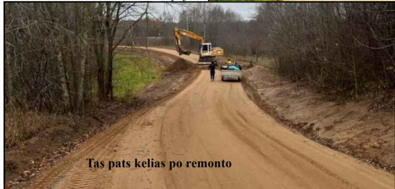
Tas pats kelias po remonto

beveik iki Smailių kaimo pabaigos. Paprastojo remonto metu atstatyti, o ten, kur nebuvo, suformuoti naujai kelio grioviai, sutvarkytos ir išvalytos senos pralaidos, o kur jų ne-