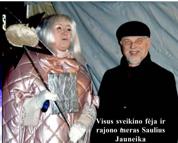
Visus sveikino fejė ir rajono meras Saulius Jauneika

line išmone, kitos - elegancija, žaismingumu ir šventiškumu. Daugelis miesto erdvių sužibo, raginant atitrūkti nuo rūpesčių ir pa-