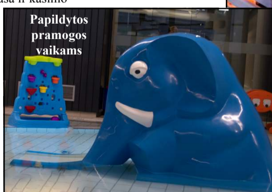
Papildytos pramogos vaikams

APIE IŠSIUGDYTĄ SAVYJE VERSLININKĄ. "Apie tai manęs niekad niekas neklausė... Baigiau Kėdainiuose V.Uspaskich įsteigtą Atžalyno gimnazijoje eko-