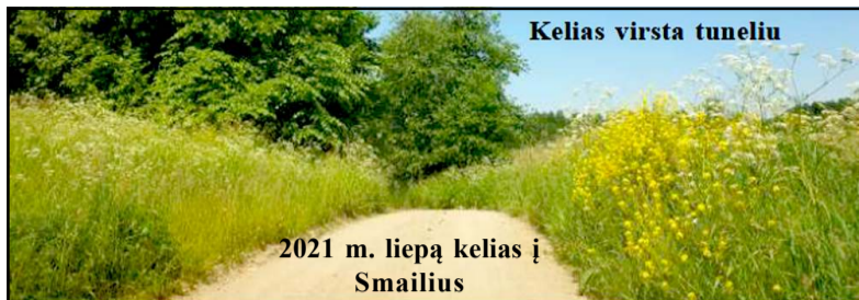
Keltas virsta tuneliu

Molėtų r. vietinės reikšmės kelių su žvyro danga remontui atlikti už beveik 100 tūkst. eurų konkursą laimėjusi UAB "Bebrusai" darbus pradėjo nuo kelio remonto Dubingių seniūnijoje Smailių kaime. Šioje vietoje suremontuota kelio atkarpa į Smailių kaimą nuo betonkelio. Iš viso remontas atliktas 2 km kelio atkarpoje