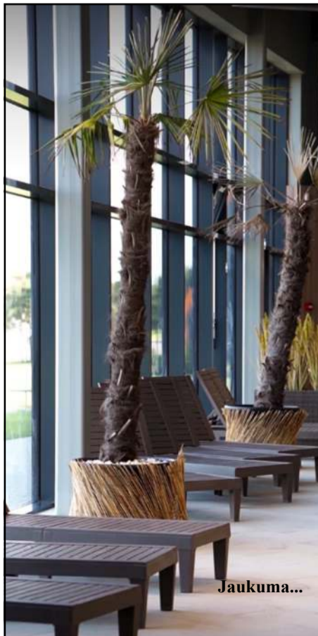
APIE LANKYTOJŲ KULTŪRĄ. "Kaip minėjau, dirbame paslaugų,

APIE KOLEKTYVĄ IR MOLĒTUS. "Pradėjome nuo 11-os, dabar jame - 28, o bus, matyt, 33 darbuotojai. Atsiskėme valymo kompanijos paslaugų, nes netiko kokybė. Esu pedantas, todėl matau viską, kas galbūt kitam neklūna. Kolektyvas geras, visi esame lygūs, bendradarbiaujantys, norintys tobulėti, pagarbūs klientui, suprantantys, jog dirbame aptarnavimo sferoje. Pastebiu, kad jau galiu čia dažnai nebūti, ko neišsivaizdavau iš pradžių, kai pradėdavau darbą 6 ryto ir baigdavau vidurnaktį. Šeima vos neiširo, nes čia viską tik investuoji, įdedi, visą laiką praleidi, o gražos kol kas jokios... Mes drauge pasiekėm tai, kas dabar, grįžtelėjus atgal, atrodo nelabai įmanoma - per kelis mėnesius paleidome į darbą baseiną... Molėtai man tapo savi, aš gi "kaimietis", man čia labai patinka, bet šeima nori būti arčiau miesto, nors sūnūs vasarą dirbo baseine - vienas picas su motoroleriu vežiojo, kitas - viduje. Regis, patiko." APIE MĖNESIO PERTRAUKĄ IR