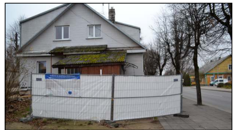
Šio septynių butų namo gyventojai Molėtų miesto Vilniaus gatvėje rinkosi kolektorinę šildymo sistemą

Tokių pavyzdžių esama ir daugiau. Dabar vykstančiame 2023 - 2025 metų etape netrukus bus renovuojamas 40 - ies butų daugiabutis Melioratorių gatvėje, Molėtuose, jo renovacijai reiks daugiau negu vieno milijono eurų, kai tuo tarpu Liepų gatvėje 25 numeriu pažymėto 42 butų daugiabučio namo renovacija 2018 metais atsiėjo 416 tūkst. eurų... O šiemet jau baigti renovuoti du namai J. Janonio gatvėje, pažymėti 30 ir 35 numeriais, artimiausiu laiku renovacija bus baigta dar trijuose namuose - J. Janonio gatvėje 8 ir 18 numeriais pažymėtuose daugiabučiuose ir Šilo gatvėje (Nr.13) Giedraičiuose. Iš 2022 - 2024 metų etapo dar trys daugiabučiai namai turi būti baigti renovuoti kitų metų pradžioje vasario - kovo mėnesiais. Tarp jų ir - Vilniaus g. 52 numeriu pažymėtas daugiabutis - medinis namas Molėtuose. Jo renovacija atsieis per 175 tūkst. eurų.