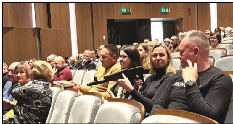
Kiekvienas galėjo pačiupinėti medinį kalašnikovą...