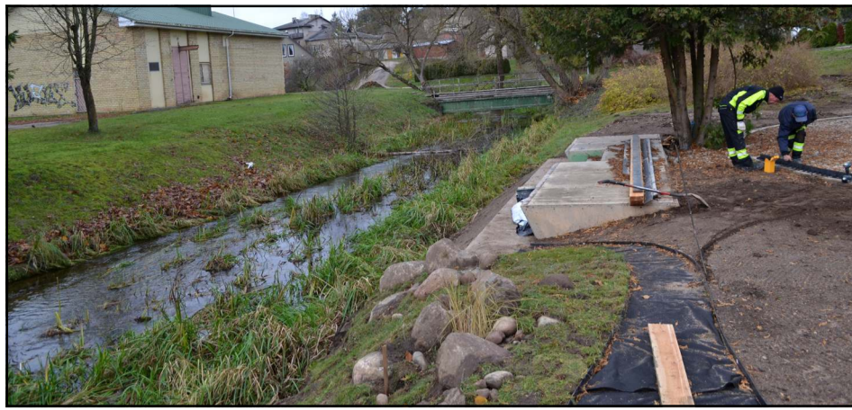
Apie upelio, kuris virtęs šabakštynu, valymą kol kas nekalbama