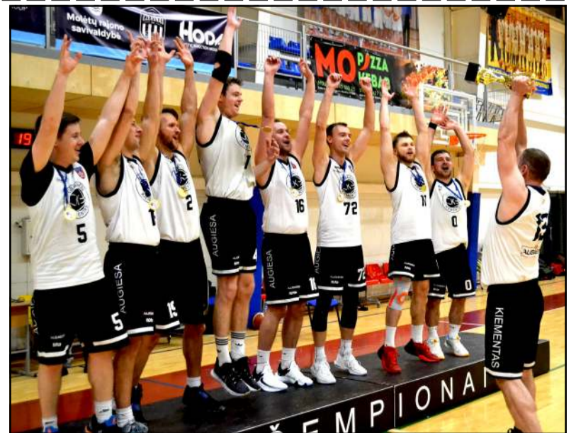
32-ojo, paskutinio "Vilnis" turnyro nugalėtojai - Giedraičių "Augiesia", pernai net nenujautė, kad turnyro istorijoje bus paskutiniai čempionai