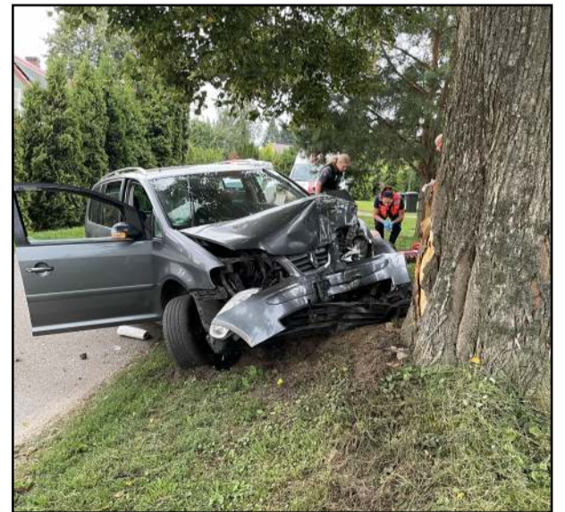
Ankstyvo ryto pasivažinėjimas baigėsi kaktomuša su pakelės medžiu...

Prokurorui nenustačius vairuotojui atsakomybę lengvinančių aplinkybių, jam teismas skyrė 40 MGL (2 tūkst. Eur) baudą. Taip pat prokuroras teismui siūlė trejus metus uždrausti