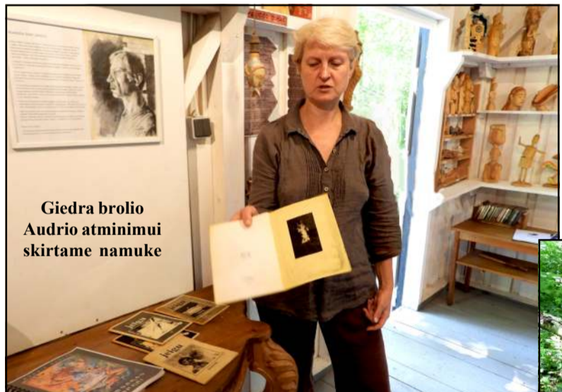
Giedra brolio Audrio atminimui skirtame namuke