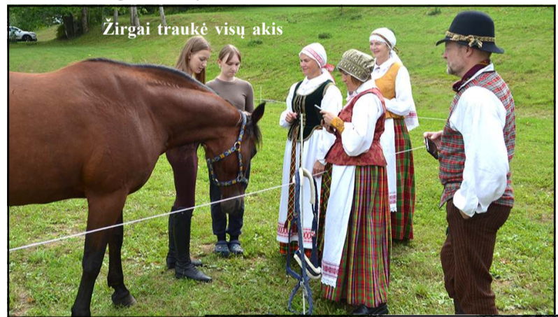
Žirgai traukė visų akis