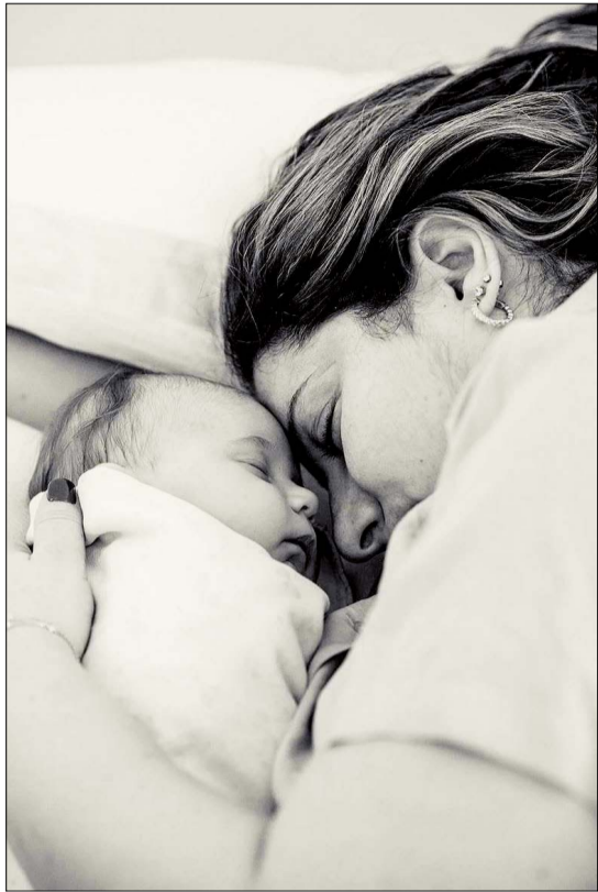
Iki 6 mėnesių rekomenduojama vaiką maitinti vien tik mamos pienu, o vėliau pradėti papildomą maitinimą tęsiant žindymą iki 2 metų ar ilgiau.

Pagrindinis iššūkis, su kuriuo susiduria žindančios mamos, – spenelių pažeidimai. Dažniausiai ši problema atsiranda, kai priešpienį keičia pereinamasis pienas – tai