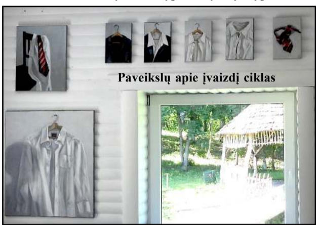
Paveikslų apie įvaizdį ciklas