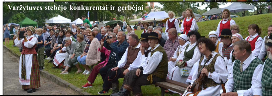
Varžytuves stebėjo konkurentai ir gerbėjai