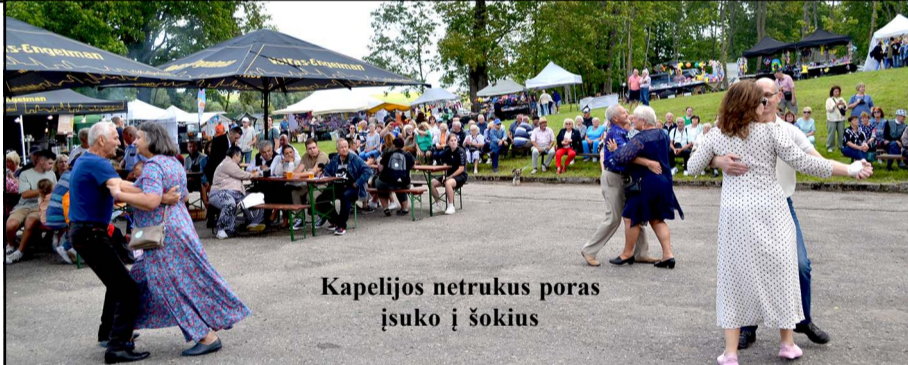
Kapelijos netrukus poras išuko į šokių