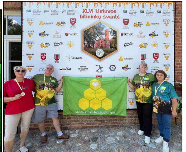
Tradiciniame bitininkų sambūryje tarp daugybės šalies bitininkų dalyvavo ir Molėtų krašto bičiųliū draugija

Tradiciniame bitininkų sambūryje tarp daugybės šalies bitininkų da-