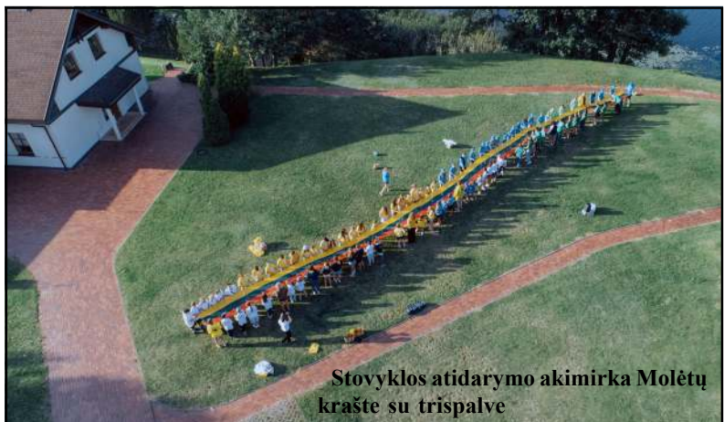
Stovyklos atidarymo akimirka Molėtų krašte su trispalve

Škotijos, Katalonijos, Prancūzijos ir Italijos mokyklų. Čiulėnų kaime, prie Virintų ežero, kaimo turizmo sody-