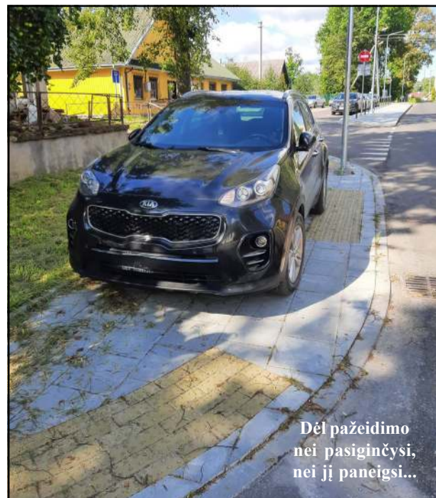
Dėl pažeidimo nei pasiginčysi, nei jį paneigsi...

vus vyras siautėjo mamos namuose, kuriuose dužo ir langų stiklai. Vyrui skirtas orderis, draudžiantis artintis prie mamos namų. Tad vyriškis grįžo į savo namus Čiulėnų s., kur irgi tęsė siautėjimą, dėl ko šeimos nariai spruko pas kaimynus ir iškvietė policiją. Atvykus pareigūnams (Nukelta į 3 psl.)