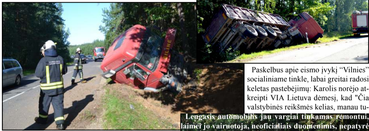
Asfaltu pakrauta sunkiasvorė įsirusė į kelkraštį Judraus kelio posūkyje, kur dažnokai įvyksta eismo įvykiai, tuoj pat susiformavo automobilių kolona