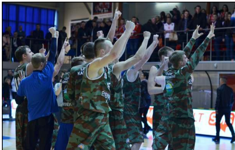
Molėtų krašto sporto aistruoliams "Ežerūnas" per 15 savo istorijos metų dovanavo daugybę nepakartojamų akimirku

Molėtų "Ežerūno" komanda informuoja, kad šiais metais ji išnyks iš Lietuvos krepšinio žemėlapiu. Išplatintame pranešime rašoma, kad per penkiolika metų trukusį komandos, kuri turėjo, beje, ir įvairių pavadinimų pridėdant "karys", "tiumenas", "atletas" gyvavimą buvo iškovota daug pergalių ir trofėjų, smagūs prisiminimai ilgam išliks atmintyje. Daugumai krepšinio aistruolių Molėtų miestas asocijuojasi su "Ežerūno" klubu, tad dėkojama sirgaliams, kurie klubo egzistavimo pradžioje netilpo į tribūnas, rėmėjams, kurie prisidėjo prie klubo egzistavimo, ko (Nukelta į 3 psl.)