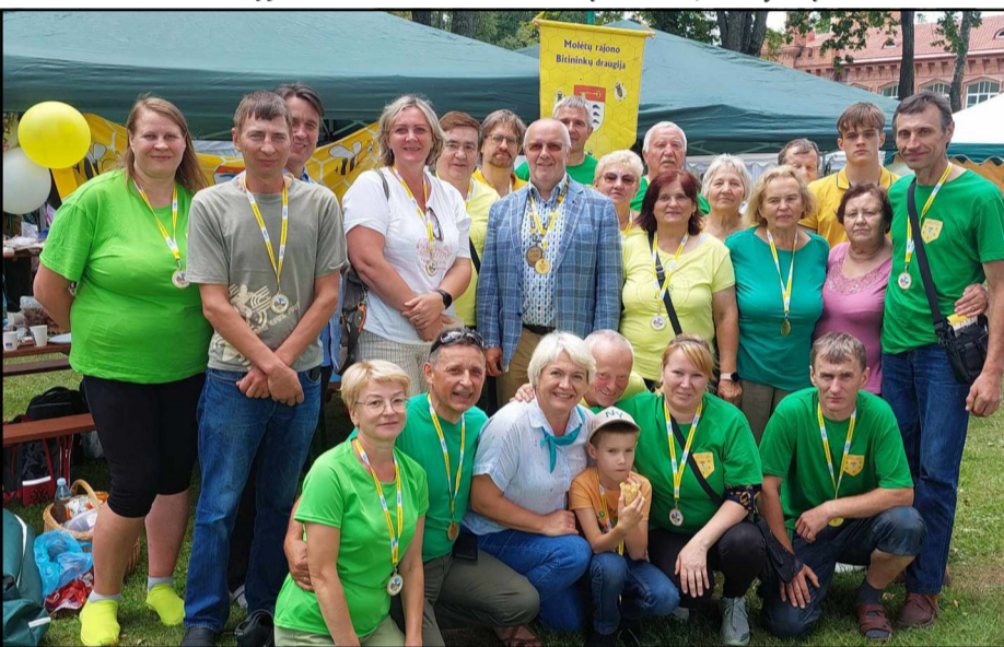
Molėtų rajono bitininkų draugijai bitininkų šventėje atstovavo net 28 nariai

roda, degustuotas midus... Susirinkusius draugėn bitininkus sveikino