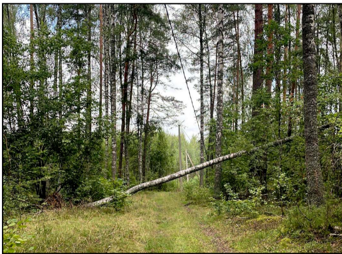
Juočių kaime ant elektros laidų kabėjo nemenkas beržas, gyventojai į ESO pagalbos kreipėsi ne vieną kartą

Rajono savivaldybės administracijoje šią savaitę surengtas susitikimas su elektros tiekimo įmonių atstovais, kurio tikslas - aptarti neseniai visoje šalyje praūžusios audros nuostolius ir nepatogumus rajono gyventojams dėl sutrikusio elektros tiekimo. Susitikime dalyvavo Ignitis, AB "Energijos skirstymo operatorius" (ESO) atstovai. Pasak jų, ESO komandos iš karto ėmėsi prižiūrimos infrastruktūros atstatymo darbų, tačiau dėl gedimų gausos jie kai kur užtruko net iki 5 ar 6 parų. Pagrindinė priežastis - medžių užvirtimas. Buvo informuota, kad Molėtų rajone dėl liepos 29-osios naktį siautusios audros 10 kV ir 0,4 kV tinkluose užregistruoti 142 gedimai, nuo elektros tinklo buvo atjungti beveik 4 tūkst. ESO (Nukelta į 2 psl.)