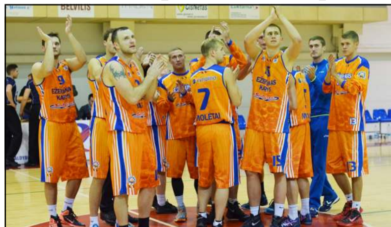
Su "Ežerūnu" augo ir jaunoji molėtiškių krepšinininkų karta