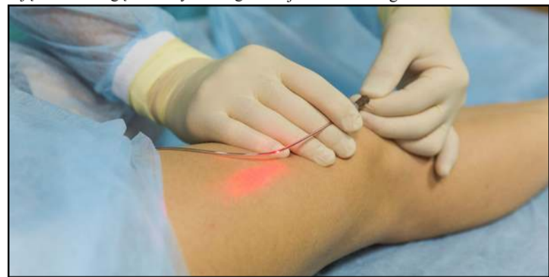
Po venų operacijos pagerinama kojų venų būklė ir pašalinami nemalonūs simptomai

Registruotis pas gydytojus specialistus galima telefonu +370 389 63861 arba internetu