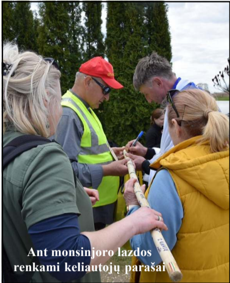
Ant monsinjoro lazdos renkami keliautojų parašai

Trečiasis "stebuklas" vyko tuomet, kai visi buvusieji bažnyčioje buvo laiminami lyg dalyvaujant ir pačiam palaimintajam Mykolui Giedraičiui, o paskui kelionės dalyviai galėjo paliesti monstranciją su palaimintojo artefaktu. Juk piligriminė kelionė tam tikra prasme yra atsidavimo ženklas- iniciacija. Kiekvieno piligrimo tikslas gali būti skirtingas. Vieniems - nuodėmių atleidimas, kitiems įžado vykdymas, tretiems - viltis, kad tam tikroje vietoje bus išklaudytos maldos, pagyta nuo ligos.