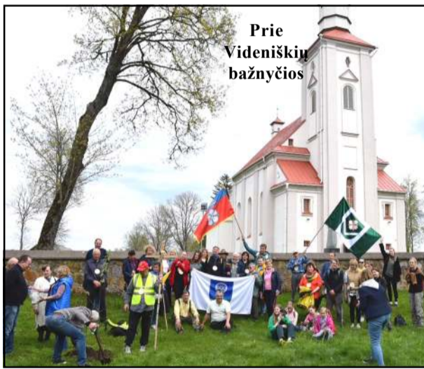
Prie Videniškių bažnyčios

sutartos vietos, šalia kryžiaus ir didžiulio akmens Suvalkinių kaimui, monsinjoras ryžosi užkopti ant šio akmens, nustebindamas ir kelionės dalyvavusius vyrus. Maža to, įveikus 20