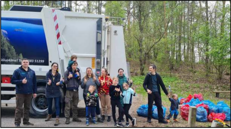
Puiki švarinimosi iniciatyva sulaukė palaikymo iš UAB "Molėtų švara"

Šauni ir kupina pozityvo talka, kurią organizavo VšĮ "Gera augti", sulaukė ne tik šeimų dalyvavimo, bet ir rimto partnerio UAB "Molėtų švara"