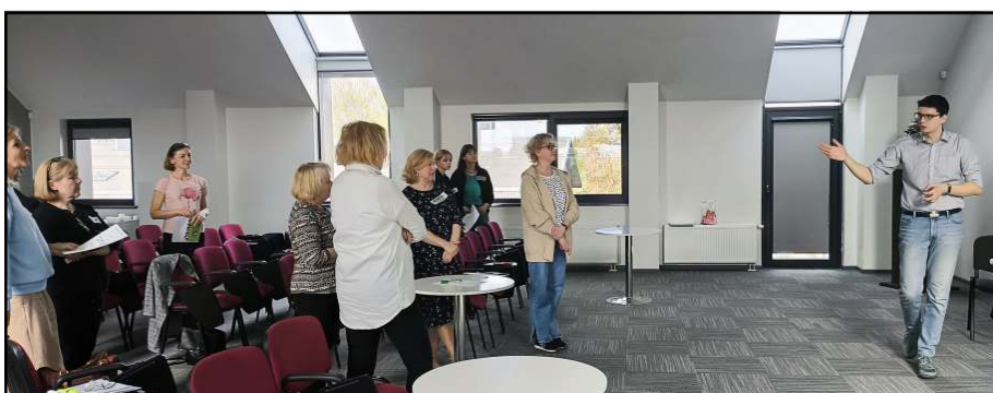
Mokymų metu nestokota gražaus bendravimo

Vykdydamos "Tūkstant- mečio mokyklų" progra- mos veiklas, kaip infor- muoja rajono savivaldy- bė, pirmadienį Alantos, Giedraičių Antano Jaroše- vičiaus, Molėtų gimnazi- jų, Molėtų progimnazijos ir Molėtų pradinės mo- kyklos komandos dalyva- vo įtraukiojo ugdymo srities mokymų "Įtraukusis ugdymas - mokykla kiek-