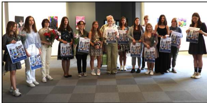
Menų mokyklos diplomantų paroda praėjusiais metais