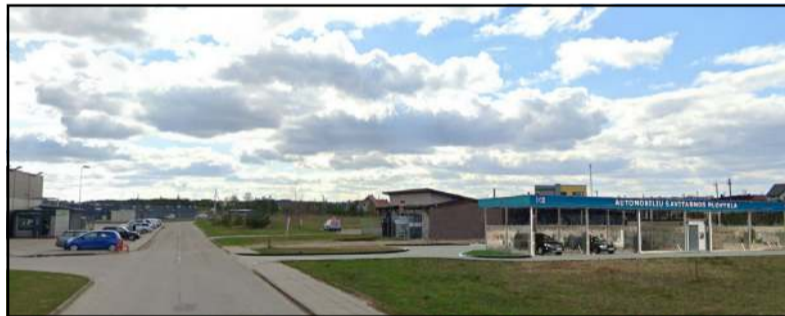
Projekto rengėjų vizualizacija

Paluokesos kvartalas netrukus, matyt, bus užpildytas įvairiausios pa-