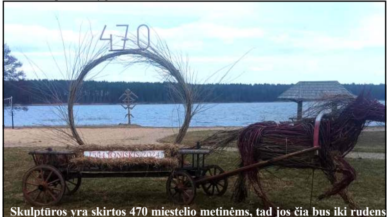
Skulptūros yra skirtos 470 miestelio metinėms, tad jos čia bus iki rudens