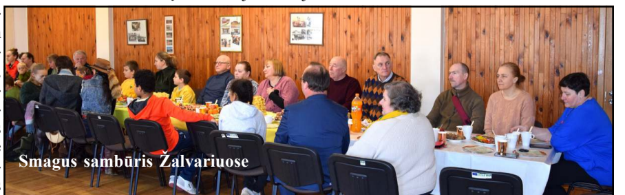
Smagus sambūris Žalvariuose