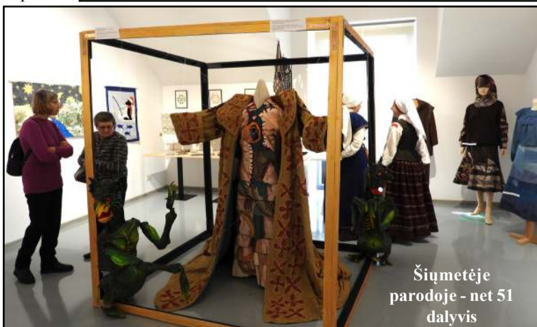
Šiųmetėje parodoje - net 51 dalyvis