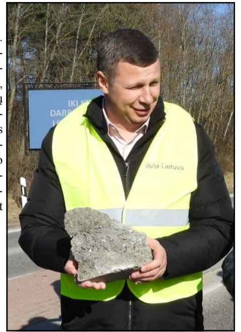
Iš darbų pradžios starto - su suvenyrais...

Šios kelio atkarpos remontas atsis 61 mln. eurų. Bus rekonstruotos dvi kelio juostos, atsiras naujos au-