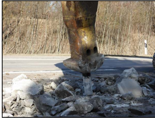
Kelis dešimtmečius suvažinėtas betonas "pasiduoda" sunkiai

šėme kontraktą, viešojoje erdvėje vis tiek tvyrojo nepasitikėjimas, ir jis, pripažinsiu, pagrįstas, nes ilgus metus visi tik žadėjo... Lai prasideda amžiaus statybos..." Rangovas - akcinės bendrovės "HISK" direktorius