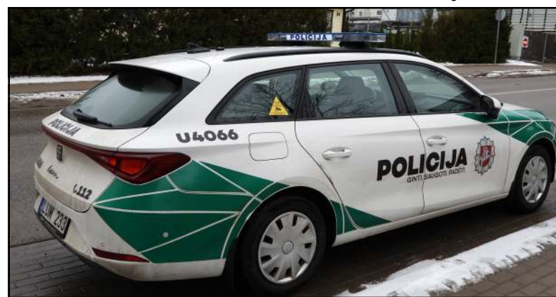
Pareigūnai skuba ir pagal ne jų kompetencijai priskiriamus pranešimus

Per dešimtį pranešimų buvo gauta dėl įvykių keliuose - iš jų dažniausias prasilenkiant veidrodėliais susikabinę automobiliai, beje, tokių incidentų daugiausia būta kelyje Mo-