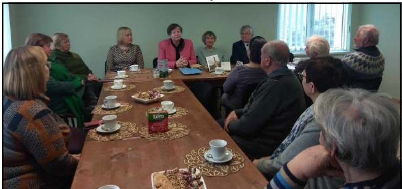
Betarpiško bendravimo su svečiais akimirka

šviesuoliai" aprašytus Balninkų krašte gyvenusius šviesuolius - kunigą Mykalojų Šeizi-Dagilėlį, kunigą, mokslų daktarą S.J. Stanislovą