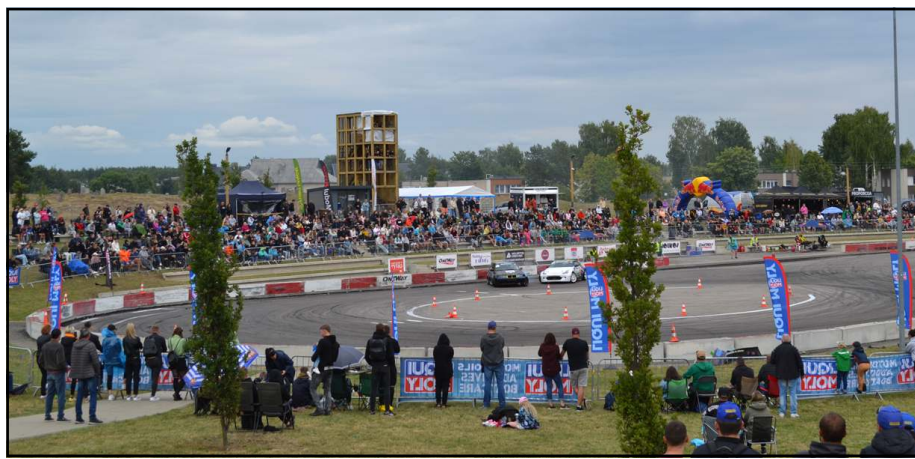
Tūkstančius žiūrovų iš visos Lietuvos sutraukiančios drifto varžybos universaliojoje aikštelėje šio sporto mėgėjų liūdesiui, o priešininkų džiaugsmui gali jau ir nebevykti...

"Mano nuomone, tai - išpūstas burbulas, kad savivaldybėms atiduoda, neva, didžiulį turtą valdyti, o iš tikrųjų tai savotiškas pasityčiojimas, nes darbu perduodamas vienas etatas, suteikiant galimybes rašyti atitinkamus sutikimus, sudaryti nuomos ir panaudos sutartis, peržiūrint sklypų dydžius, - komentavo naujas funkcijas pašnekovas. - Vertinu tai, kaip savivaldybėms numestas spręsti trisdešimties metų NŽT pridarytas klaidas ir visokius nesuspėjimus, dėl kurių ir šiandien vyksta ginčai, į paviršių iškyla vis nauji, o visą kontrolę pasilieka NŽT sau, prisikūrus tam tikslui etatų - atseit, tikrins, ar pas mus nėra korupcijos. O mes išdavinėsim leidimus in-