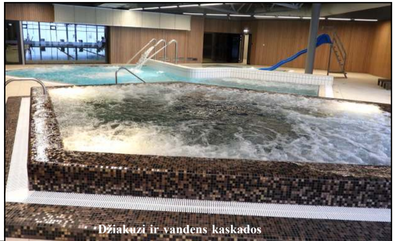
Džiakuzi ir vandens kaskados

vartojo elektros nei bus tuomet, kai startuos pilnu pajėgumu, sąskaita buvo - 2,7 tūkst. Eur. Tiesa, į šią sumą įeina ir galios mokėstis - 560 Eur, dėl kurio teks daryti defektaciją, nes pagal statinio projektą buvo užsi-prašyta per didelės galios. Jau galvojama apie saulės elektrinę ant stogo, galbūt ir nutolusių turimame sklype, nes dabar palankus metas teikti paraišką finansavimui gauti.