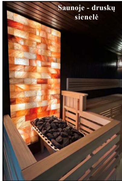
Saunoje - druskų sienelė