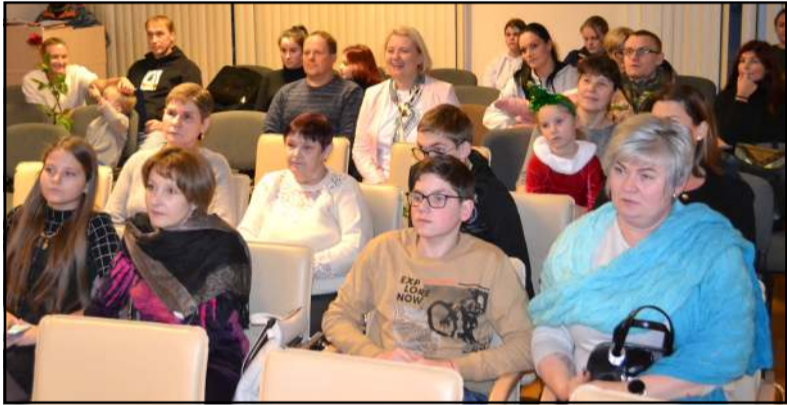
Globėjų šeimų Molėtų rajone kasmet daugėja