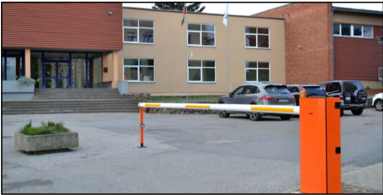
Prie mokyklų atsiradęs užtvarys - diskusijų objektas

Po publikacijos "Vilnyje" "Pastarūšis kelio užtvarys, problema išspręsta?", kurioje rašoma apie tai, kad prieš mėnesį įvažiavime į Molėtų gimnazijos, progimnazijos ir Menų mokyklos bendrą kiemą sumontuotas automatinis kelio užtvarys, pro kurį gali įvažiuoti bei kieme parkuoti automobilius tik mokymo įstaigų darbuotojai, sulaukėme skaitytojų reakcijos į publikaciją. Į "Vilnies" redakciją paskambinęs molėtiškis (redakcijai prisistatė) dėstė, kad, jo nuomone, situacija absurdiška pasidaryti privačią aikštelę mokyklų kieme, kad mokytojai galėtų automobilius pasistatyti. "Molėtuose, o ir rajone nėra nei vienos ugdymo įstaigos, kurios kiemas būtų skirtas ne vaikams, o automobiliams... Ir kituose miestuose mokyklų kiemai ir yra kiemai, o ne parkavimo