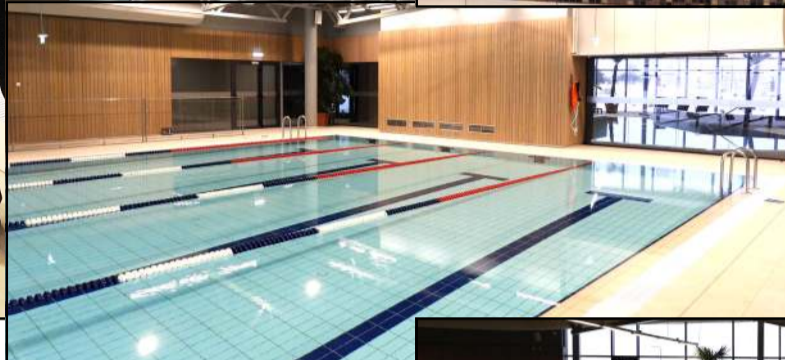
Pažintis su baseino erdvėmis iš arčiau - jau nuo sekmadienio vyksiančiose atvirų durų dienose

bės įsipareigojimų gyventojams, kurių laikas, kainos ir kiekis nediskutuotini, bus ir verslas, kuris turi išgyventi. Kainos išsmaiai ir pagal laikotarpį bei pasirinktas valandas lankyti baseiną, pirtis, o vėliau - ir treniruoklių salę bus pristatytos atvirų durų dienų metu, jas glaima rasti ir baseino tinklalapyje ar