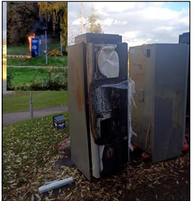
Ugnis suniokojo kavos aparatą Molėtų mieste Pastovėlio ežero pakrantėje

Molėtų priešgaisrinė gelbėjimo tarnyba per spalio mėnesį gavo net 41 pranešimą apie nelaimę, gaisrus, buvo vykstanta į pagalbą prašant policijai, medikams ir t.t. Didžiąją dalį pranešimų sudarė ant kelio važiuojamosios dalies nuvirtę medžiai. Dėl tokių pranešimų spalyje ugniagesiai gelbėtojams vyko net 25 kartus... Pagalbos atidarant butų, namų duris buvo prašoma keturis kartus, du kartus vykta dėl eismo įvykių. Per mėnesį kilo šeši gaisrai. Iš jų vieno būta beprecedencio, kuomet pusamžis vyras pats save padegė... Medikams jo gyvybės išgelbėti nepavyko. Didelis gaisras spalio mėnesio viduryje kilo Ažubalių kaime (Luokesos s.), kurio metu sudegė savi-