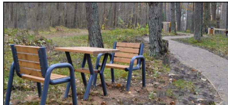
Nutiesti nauji takai, įrengtos atokvėpio zonos su patogiais suolais ir stalais

Nacionalinė mokėjimo agentūra prie Žemės ūkio ministerijos vietos projektui "Viešosios infrastruktūros sukūrimas Mindūnų seniūnijoje pagal Žuvininkystės Regiono Vietos Veiklos Grupės "Vilkauda" paraišką skyrė paramą, kurios intensyvumas 89 proc. Europos jūrų reikalų ir žuvininkystės fondo lėšos paramoje sudarė beveik 27 tūkst. eurų, valstybės biudžeto lėšos - beveik 5 tūkst. eurų. Projektas jau įgyvendintas, jo metu sukurta vaikų žaidimo aikštelė kartu su poilsio zona suaugusiems. Be to, sutvarkyti krūmai ir medžiai, nutiesta naujų takų, pastatyta suolų ir stalų, edukacinių lauko žaidimų vaikams lentų ir t.t. Infrastruktūra prie Mindūnų apžvalgos bokšto kinta neatpažįstamai ir nepa-