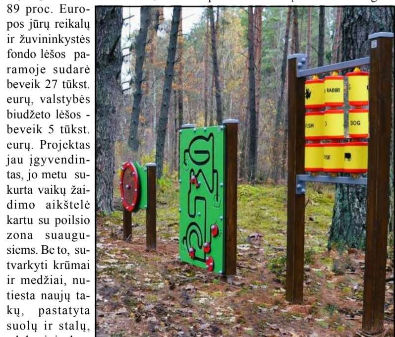
Lauko žaidimai vaikams

lyginamai su pradine situacija. Tai begaliniai gražios naujienos ir darbai. Tik vienas sukirbėjęs bevaikštant klausimas - kodėl mūsų vaikams žvėriukų pavadinimai edukacinėse lauko žaidimų lentose yra užsienio kalba? Ne prieš anglų kalbą, bet juk pirmiausia turėtų būti mūsų - gim-