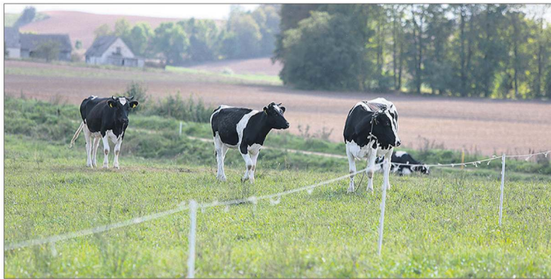
Parama ūkiams – ir naudinga, ir reikalinga: pavyzdžiui, pienininkystės veikloje ji svarbi, nes pieno supirkimo kainos daug metų nedidėja, o visa kita brangsta.

Nacionalinės mokėjimo agentūros duomenimis, per visą KPP laikotarpį su smulkių ūkių savininkais pasirašyta daugiau kaip 10 tūkst. sutarčių. Dauguma pareiškėjų paramos lėšas naudojo žemės