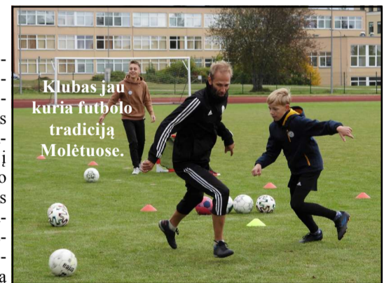
Klubas jau kuria futbolo tradiciją Molėtuose.