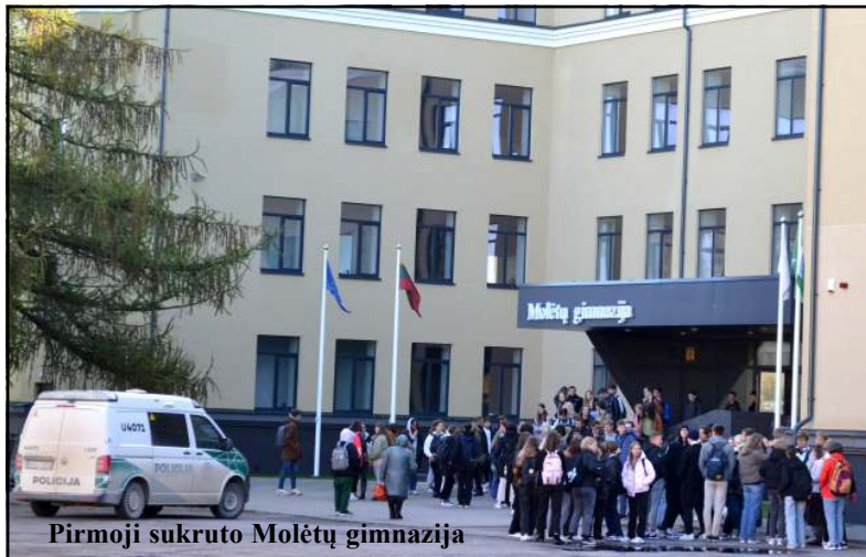
Pirmoji sukruoto Molėtų gimnazija

Teroristinei grupei „Hamas“, kuri spalio 7 dieną pradėjo puolimą prieš Izraelį, paraginus spalio 13 dieną - penktadienį, išeiti į gatves, palaikyti Izraelį užpuolusią „Hamas“ islamistų grupuotę, socialiniuose tinkluose ėmė plisti raginimai tądien pulti žydus bei su žydų bendruomene susijusius objektus, o ryte daugelis mūsų šalies ugdymo įstaigų gavo grasinančius elektroninius laiškus, kuriuose pranešama apie įstaigoje padėtą bombą, kuri bus detonuota 11.25 val. Vienos įstaigos nutraukė ugdymo procesą, kitose vyko evakuacija. Molėtų rajone grasinančius laiškus apie padėtus prognesis gavo trys ugdymo įstaigos - Molėtų gimnazija, Kijelių spec. ugdymo centras ir Giedraičių A. Jaroševičiaus (Nukelta į 2 psl.)