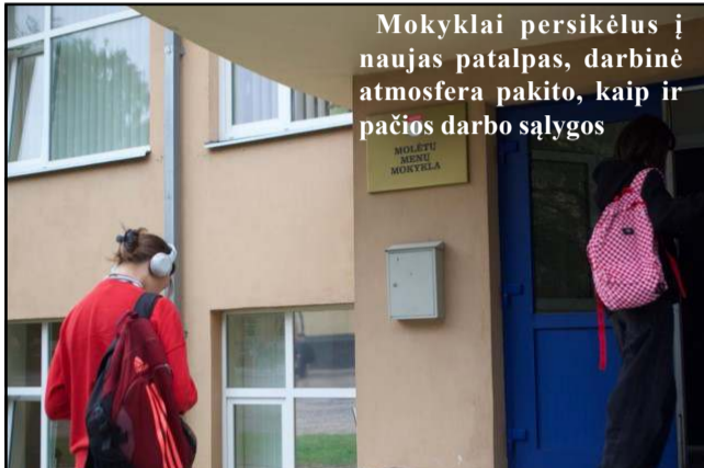
Mokyklai persikėlus į naujas patalpas, darbinė atmosfera pakito, kaip ir pačios darbo sąlygos

systemoje egzistuojanti specialistų trūkumo problema?