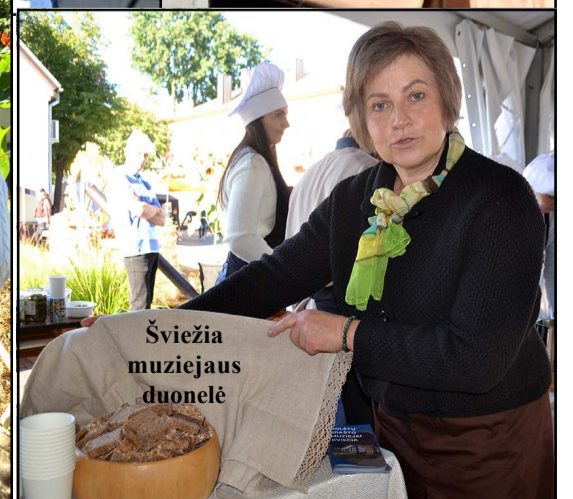
Šviežia muziejaus duonelė