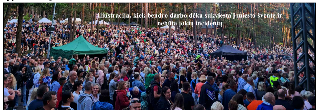
Ilustracija, kiek bendro darbo dėka sukviesta į miesto šventę ir nebūta jokių incidentų