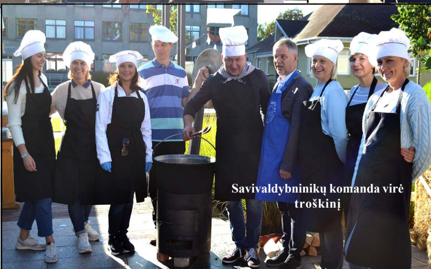
Savivaldybinių virėjų komanda virė troškinį