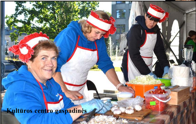
Kultūros centro gospadinės