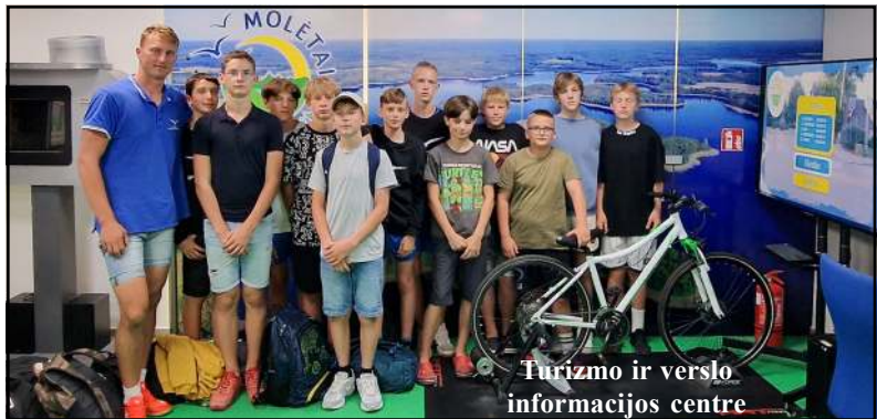
Turizmo ir verslo informacijos centre

tų turizmo ir informacijos centro virtualioje erdvėje „Molėtai kitaip“, kurioje susipažinome su Molėtų istori-