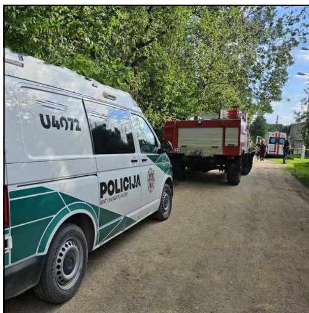
Arnionyse penktadienio pavakarę po tragiškai pasibaigusio sprogimo darbuosiva visos spec. tarnybos, atskubėjo Aro pareigūnai

Dar viena nelaimė įvyko sekmadienio dieną stovyklavietėje Gojaus kaime (Luokesos s.). Iš stovyklavie-