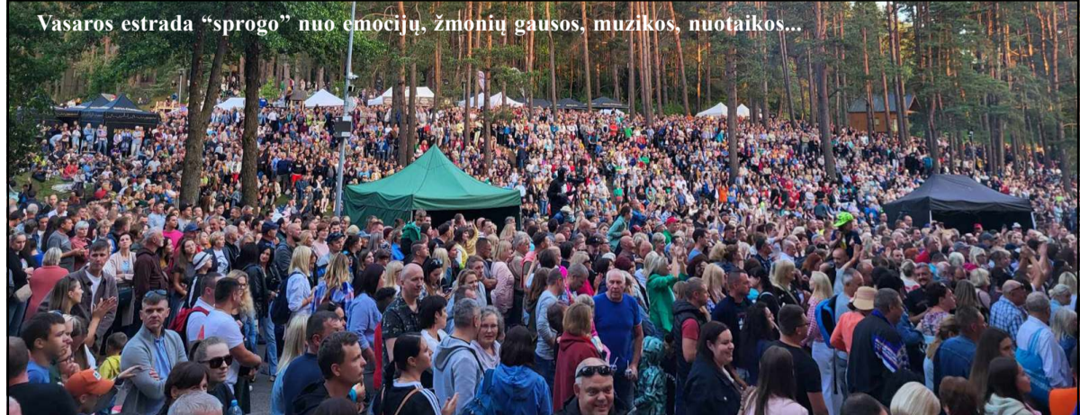
Vasaros estrada "sprogo" nuo emocijų, žmonių gausos, muzikos, nuotaikos...