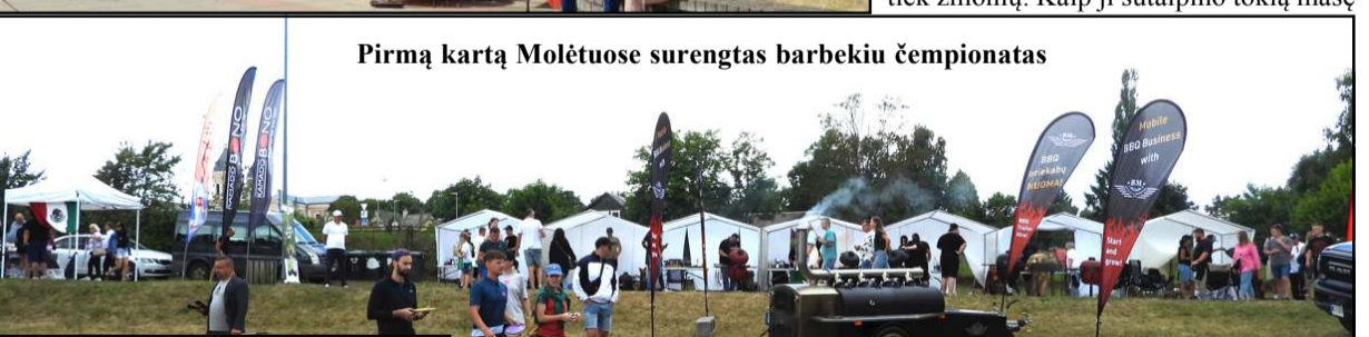
Pirmą kartą Molėtuose surengtas barbekiu čempionatas

Jau vakarėjant minios molėtiškių ir svečių traukė į Vasaros estadą, kuri tikrai seniai ebregejo, o gal iš viso neregėjo tiek žmonių. Kaip ji sutalpino tokią masę