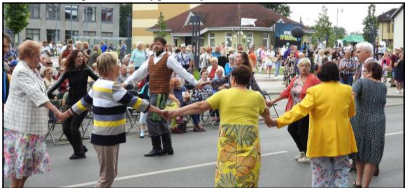
Šokta, dainuota, grota, išdykauta ir...švęsta