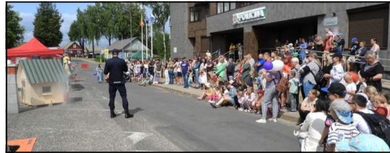
Ugniagesiai gelbėtojai kiekvienoje šventėje vis išradingiau pateikia molėtiškiams profilaktinių pamokų