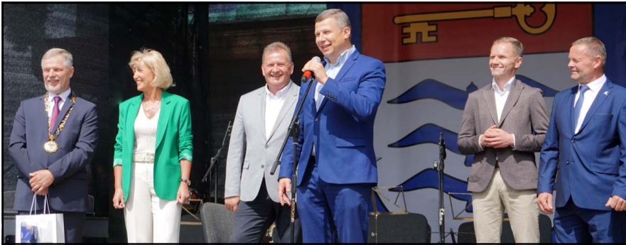
Bemaž pirmą kartą Molėtų miesto šventėje sulaukta tiek daug kaimynų