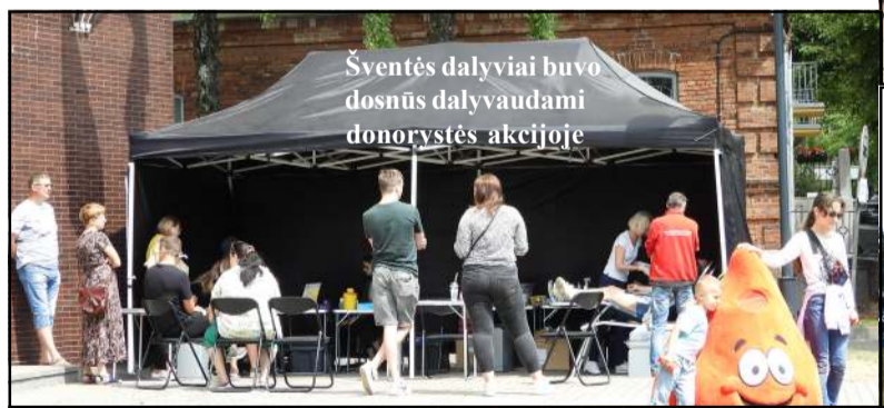
Šventės dalyviai buvo dosnūs dalyvaudami donorystės akcijoje