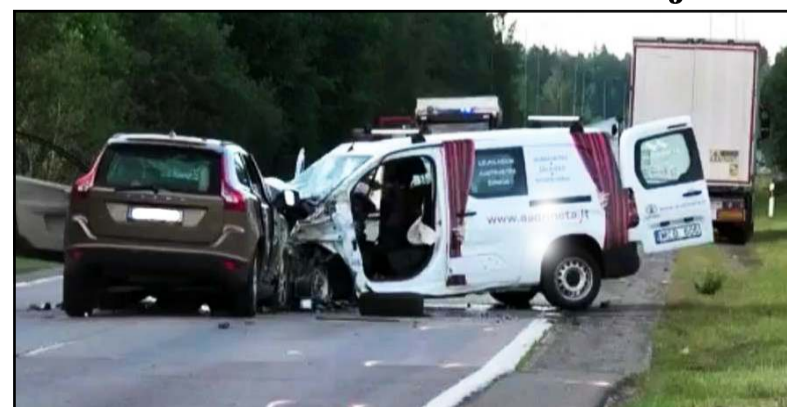
Eismas betonkelyje dėl avarijos buvo uždarytas