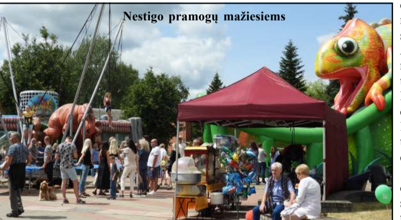
Nestigo pramogų mažiesiems

čionių, Anykščių, Ukmergės, Utenos merai, vicemerais ar merų padėjėjai... O po svečių sveikinimų į sceną kopė Rytų Aukštaitijos liaudiškos muzikos ir tautinių šokių "Aukštaitijos vainikas" kolektyvai iš Vilniaus, Raseinių, Anykščių, Molėtų... Keleto valandų trukmės koncertinę programą dovanojo septyni kolektyvai, o aštuntąjį, išdalinę instrumentus, iš molėtiškių žiūrovų subūrė vilniečiai kapelija "Sutaras"!