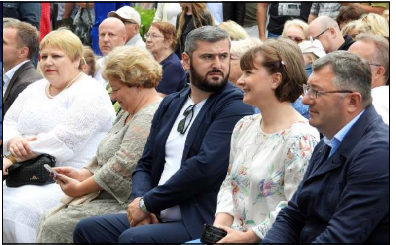
Su sveikinimais atvyko delegacijos iš Ukrainos ir Sakartvelo

deliam būriui šventės dalyvių, "degė namas", liepsnos ir kibirkštys veržėsi iš dūmtraukio. Nors ir labai smagu miesto centre, bet kai žinai, kad miesto paplūdimyje vyksta Barbekiu fiesta - čempionatas "Ugnis kalba, Dūmas šnabžda", kojos pačios ten nuneša. O ten apie vidurdienį jau