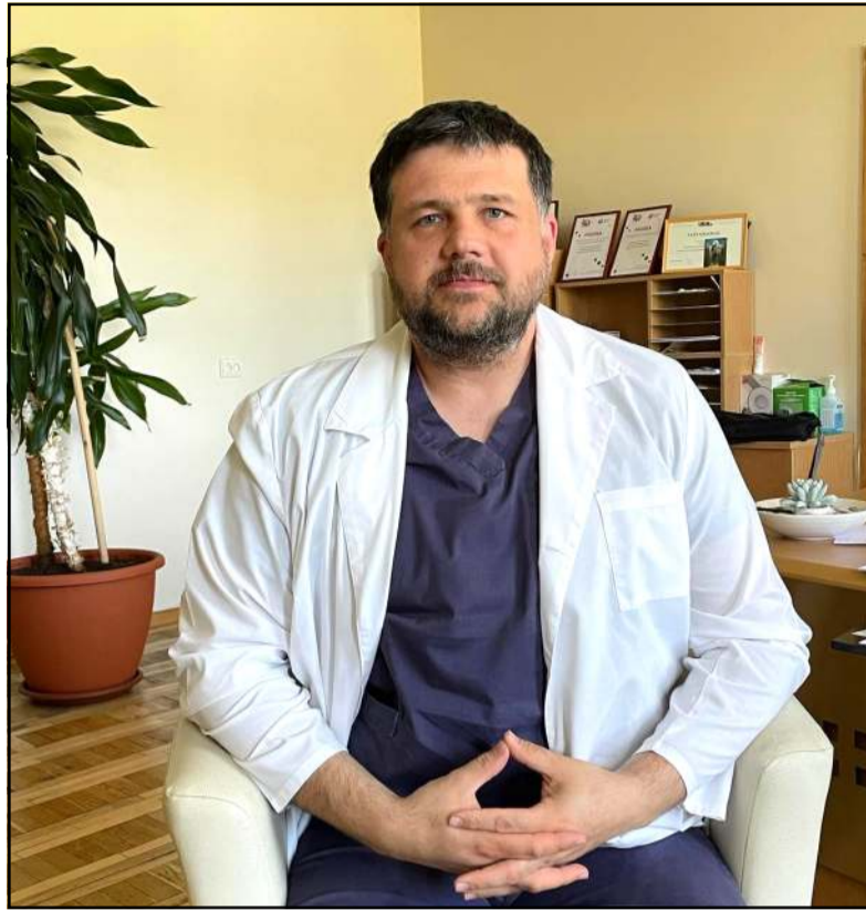
Direktorius sako, kad tikėtina, jog gali būti apribota galimybė būti vadovu, tačiau bet kokių atvejų liks Molėtuose, nes jo pašaukimas gydytojo darbas

sirinkimuose ateiti dirbti būtent pas mus vis dar dvejoja ir dėl to, kad mūsų neiški ateitis dėl numatomų struktūrinių pokyčių. Ir dar - kai kurie mielai renkasi Širvintas, nes ten iš sostinės kelias geresnis, nors pas mus atvažinėjančių medikų tikrai daug. Tiesa, per sambūrį Etnokologijos muziejus ligoninių vadovų gidas klausė, kas bus greičiau - misija į mėnulį ar sutvarkytas betonkelis. Atsakiau, kad misija. Tuo įsitikinęs... Centro finansavimas, matyt, būtų priklausomas ir nuo prisirašusių pacientų skaičiaus, ir nuo suteikiamų paslaugų kiekio, gal papildomi bonusai būtų už jų perviršį - srautus... Tarybos sprendimas dėl specialistų pritraukimo rezultatus turės ne iš karto, juk rezidentūra trunka ne vienerius metus, o specialistų reikia čia ir dabar.