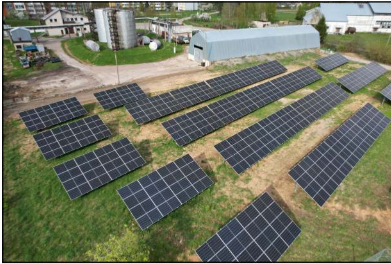
Bendrovės įsigytame sklype su APVA parama įrengta saulės elektrinė per mėnesį pagamino du kartus daugiau elektros energijos negu bendrovei reikia

Bet juk yra daugybė tikrintojų, atsakingų institucijų, kurios galbūt turėtų susidomėti, kokie dūmai virsta iš individualių namų ar vis dar turimų įstaigų katilinių kaminų? Pašnekovas sako, jog UAB "Molėtų šiluma" katilinės visa įranga nuolat tikrinama, testuojama, todėl gali garantuoti, jog mediena kūrenami katilai yra netaršūs, o pati įranga yra pakankamai šiuolaikiška, atitinka visus standartus. Naujusias katilas, patstatytas 2018 metais, yra visiškai automatizuotas, galbūt pirmasis - vadinamas daniškuoju, yra senas, bet jo automatinis lygis geras. "Mūsų kaminas išmeta į orą puikiai išvalytus dūmus, nes yra ekonomaizeris, kuris užtikrina problemos dėl smulkiųjų detalių patekimo į erdvę sprendimą. Į dūmus purškiamas vanduo,