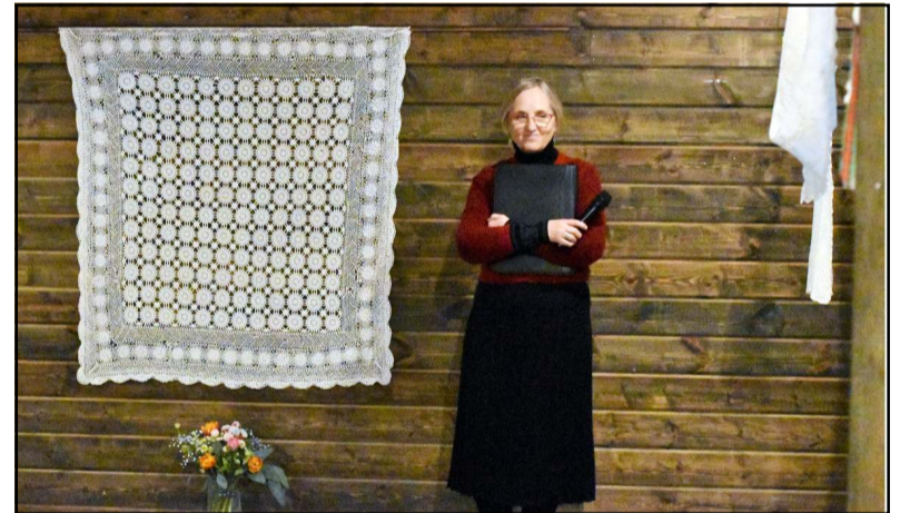
Parodoje, pristatant rankdarbius, kurie dabar dažnai nesulaukia tinkamo dėmesio, daug kalbėta apie tai, ko negalim apčiuopti - meilę...