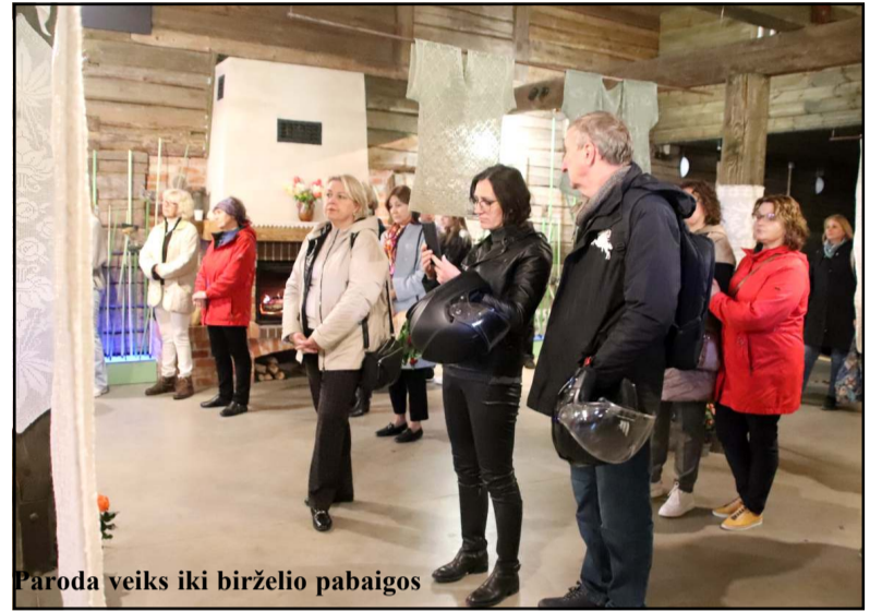
Paroda veiks iki birželio pabaigos