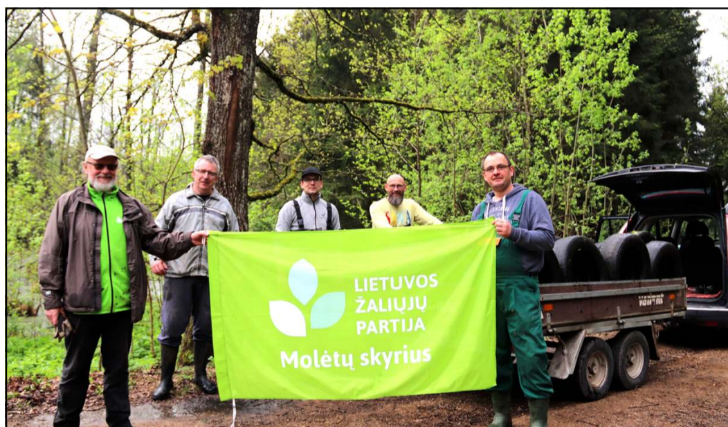
Kamastos draustinį apvalėme nuo padangų