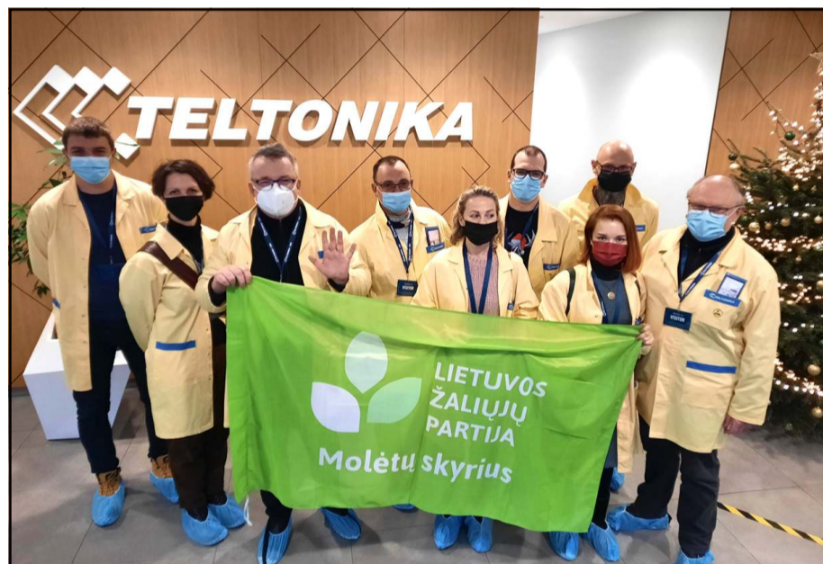
Draugiško aplinkai verslo kūrimasis ir atėjimas į mūsų rajoną - vienas iš mūsų veiklos prioritetų, todėl itin domėjomės, kaip dirba tuo metu dar į mūsų rajoną investuojantis verslas