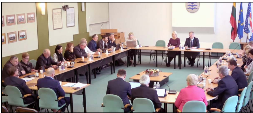
Šios kadencijos tarybai beliko keletas posėdžių