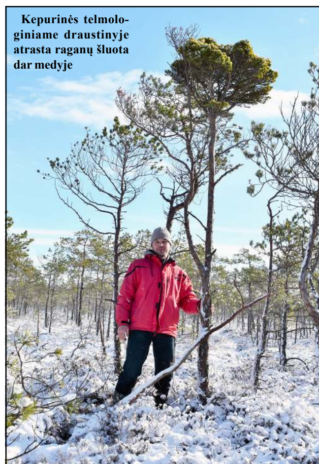
Kepurinės telmologiniame draustinyje atrasta raganų šluota dar medyje

Pelkės tai - pasaulio inkstai. Jos atlieka labai svarbų vaidmenį ekosistemoje. Todėl dauguma pelkių yra paskelbtos telmologiniais draustiniais ar rezervatais. Mano augalų paieškoms tinkamiausios yra aukštapelkės. Jose auga pušys, kuriose ir ieškau raganos šluotų. O jei miške rudenį aptinki šluotą, tai pavasarį atvykęs skinti, gali neberasti ne tik šluotos, bet ir viso miško. Pelkėse kitaip, ypač kurios paskelbtos telmologiniais draustiniais. Kadangi jose uždrausta veikla ir ribojamas laikas, kada galima lankytis, tai didelė tikimybė, jog aptikęs šluotą rudenį ar žiemą, ir grįžęs nuskinti pavasarį, ją vėl surasiu. Nors aišku, būna, kad ir vėjas ar sniegas nulaužia, gali ir žvėris prabėgdamas užkliudyti. Pelkėse smagu dar ir todėl, kad daugelis pušų yra žemos ir šluota lengviau pasiekiamas. Kartais tenka lipti, bet, žinoma, ne į tokius aukščius, kaip brandžiame pušyne. Pelkėse ir augmenija kitokia, nes ten tvyro ramybė. Per daugelį metų vaikščiojant pelkėse teko sutikti tik žvėris ir paukščius. Pavasarį gražu stebėti gervių šokius, arba pelkės pakraščiuose, kur jos susijungia su miško aikštelė-