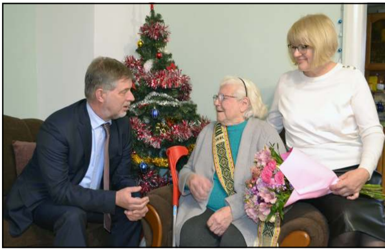
Garbingo jubiliejaus proga Čivylių kaimo gyventoją sveikino rajono meras ir Suginčių seniūnė