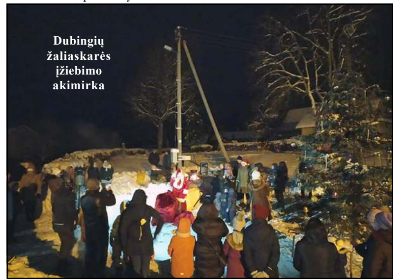
Dubingių žaliaskarės įžiebimo akimirka