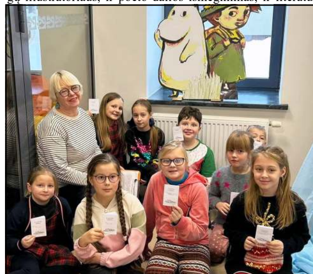
Vikingų laivu keliavo ir Molėtų pradinės mokyklos pailgintos darbo dienos grupės moksleiviai

(Atkelta iš 4 psl.) dami skirtingi šampūkai, įvykdžius tam tikras užduotis... Dizainerių sugalvoti meniniai sprendimai neleis nuobodžiauti ir suaugusiems, jei tik šie norės prisijungti prie savo atžalų. Čia lauks ir knygų iliustratoriai, ir poeto dalios išmėginimas, ir literatūrinio žemėlapio dėlionė.