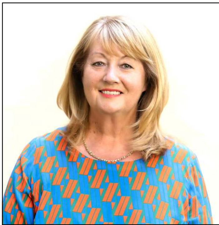
Vilija Blinkevičiūtė: "Dažnai žmonių akyse matau daug nerimo dėl ateities. Bet tose pačiose akyse matau daug šviesos, gerumo ir supratimo, kad tik padėdami vieni kitiems sulauksime geresnių laikų."

Dar kovo pabaigoje Europos Parlamentas paragino valstybes nares ir Europos Komisiją nedelsiant užtikrinti didesnę maisto produktų gamybą ES. Paragino ne tik didinti vietinę maisto produktų gamybą, bet ir žemės ūkio paskirties žemę naudoti tik maisto produktams ir pašar-