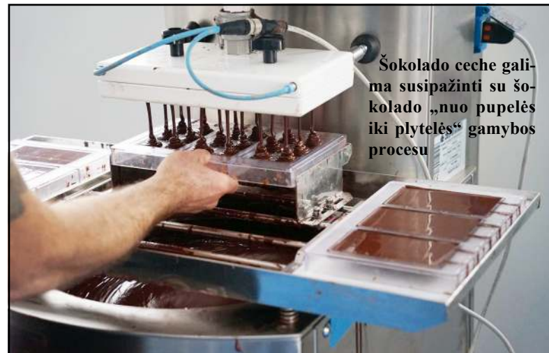
Šokolado ceche galima susipažinti su šokolado „nuo pupelės iki plytelės“ gamybos procesu

jas pristato dvi šokoladų linijas. Pirmoji – apie kakavos pupelę, atskleidžiant jos ir kakavos ūkių regionams būdingus skonių, aromatų. Šie šokoladai pagaminti iš kakavos pupelių, užaugintų specializuotuose Peru, Kongo, Filipinų, Indijos kakavos ūkiuose. Antroji – skoninė linija.