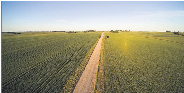
Norintieji gauti paramą negalės metų metus tame pačiame plote auginti tų pačių kultūrų – turės keisti vietas, kad nebūtų alinamas dirvožemis.

EK 2022 m. lapkričio 21 d. patvirtintas Lietuvos žemės ūkio ir kaimo plėtros 2023–2027 m. strateginis planas (toliau – Strateginis planas) – tvaraus ir aplinkai draugiško žemės ir maisto ūkio plėtros, ūkių, ypač smulkiųjų ir vidutinių, konkurencingumo, kartų kaitos kaime skatinimas. Šiam kokybiškai naujam paramos teikimo laikotarpiui svarus pamatas padėtas įgyvendinant Lietuvos kaimo plėtros 2014–2020 m. programą (toliau – KPP).