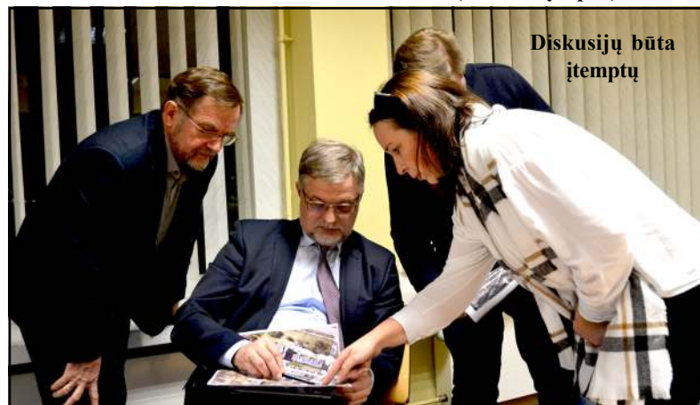
Diskusijų būta įtemptų

miesto priežiūrą atsakingam vyr. (Nukelta į 3 psl.)