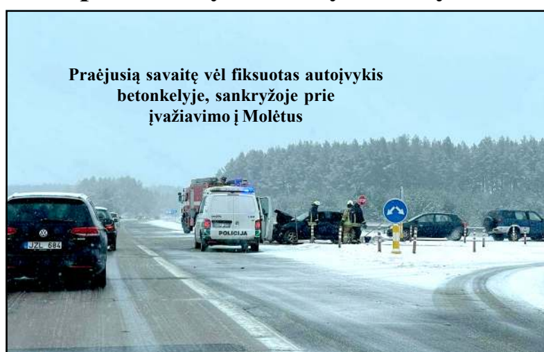
Praėjusią savaitę vėl fiksuotas autoįvykis betonkelyje, sankryžoje prie įvažiavimo į Molėtus

Sužinojęs, kad Molėtų rajone išsodybų yra įvykdytos vagystės, sodybos Balninkų s. savininkas suskubęs pasidalinti su policijos pareigūnais vaizdo stebėjimo kamerų įrašais, kuriame prieš jo sodybos užfiksuotas asmuo, atvažiuojęs keturračiu su priekaba. Anot pranešėjo, ko gero, asmuo pasišalinęs pastebėjęs kameras. O vagystės iš sodybų Molėtų rajone tęsiasi. Po ilgesnio laiko į sodybą Joniškių s. atvykusi jos savininkė policijai pranešė apie įvykdytą vagystę – iš sodybos pavogta benzininis trimeris, elektrinis grandininis pjūklas, statybinis siurblys, du keramikiniai oro šildytuvai, elektrinis valties variklis. Padaryta žala – 675 eurai. Dėl išvažinėto sklypo, kuriame pasėta veja ir jame padaryto kelio, į pareigūnus kreipėsi Giedraičių s. gyventojas, pridūręs, kad įtarimų, kas važinėja jo sklypu, neturįs. Mindūnų s. kilo konfliktas tarp kaimynų, besinaudojančių servitutiniu keliu. Konfliktas kilo, kai kaimynas kitam kaimynui kelią užtvėrė savo automobiliu. At-