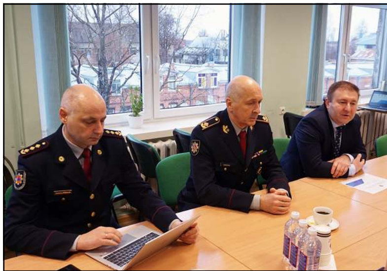
Svečiai pristatė numatoma reformą, kurioje pirmieji, pasirinkę pilotinį projektą, dalyvauja radvilniškiai