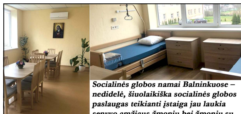
Socialinės globos namai Balninkuose – nedidelė, šiuolaikiška socialinės globos paslaugas teikianti įstaiga jau laukia senyvo amžiaus žmonių bei žmonių su

Prenumeruokite "Vilnij" nuo bet kurios mėnesio dienos! Su pristatymu į namus - 5,50 Eur./1 mėn. Užsiprenumeruoti galite el.p. reklama@vilnis.lt, tel. 865244882, išsikviestę mobilų laiškininką ar užsukę į redakciją. Draugaukime!