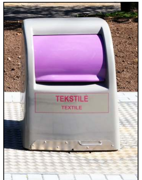
13 konteinerių tekstilei bus pastatyta Molėtų mieste