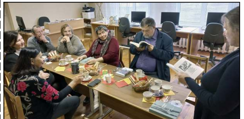
Knygos pristatymas Levaniškių bibliotekoje