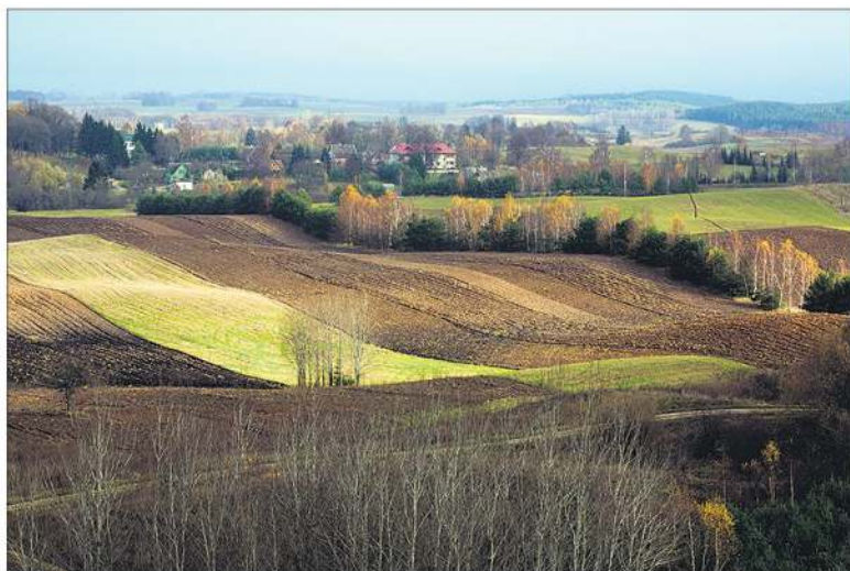
Strateginiam planui įgyvendinti skirtos lėšos – didelė pasipirtis Lietuvos ūkiams plėstis.

„Žemės ūkis negali būti įstrigęs praėjusiam amžiuje – keičiasi geopolitinė situacija, daugėja išbandymų dėl klimato, auga vartotojų lūkesčiai. Prisitaikyti prie šių išmėginimų, prie Europos žaliųjų kursų tikslų, atsizvelgiant ir į apsirūpinimo maistu saugumo svarbą, ir skirta naujojo laikotarpio parama“, – kalbėdamas apie paramą šalies ūkininkams bei pokyčius, susijusius su Lietuvos žemės ūkio ir kaimo plėtros 2023–2027 m. strateginiu planu, akcentuoja žemės ūkio ministras Kęstutis Navickas.