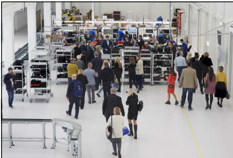
Visiems forumo dalyviams buvo organizuota ekskursija po jau dirbančio centro patalpas

Po trumpos diskusijos, kurioje atsakyta ir į dalyvavusiųjų klausimus, apie tai, koks Molėtų paveikslas Lietuvos kontekste, pranešime „Lietuvos ekonomikos tendencijos ir perspektyvos. Iššūkius paversti galimybėmis – misija privaloma“, kalbėjo Gediminas Šimkus, Lietuvos banko valdybos pirmininkas, Molėtus pavadinęs „Lietuvos Šveicarija“, mat šioje šalyje išskirtinis gamtos potencialas puikiai dera su aukštųjų technologijų plėtra ir aukštos pridėtinės vertės verslu – „visai, kaip Molėtuose...“. G. Šimkus sakė, kuo turi džiaugtis Molėtai – atsiradusiu nauju mūsų mieste žodynu – technologijos, progresas, inovacijos ir t.t, kas tapo ne didiesčio kalba, o šio miesto. Kalbėdamas apie ekonomiką, jis sakė, kad praėjusieji metai buvo itin sėkmingi, šie kur kas prasčiau, nors vis dar turime ekonomikos augimą. Svarstyta apie ekonominius lūkesčius, nuotaikas, kai gamyba ir eksportas pasuko žemyn, infliaciją, mažėjanti perkamoji galia, darbo rinką, kurioje jis pastebys