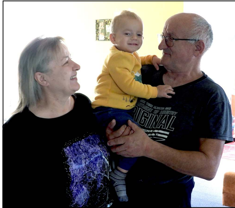
Mažasis Karolis laimingas globėjų šeimoje

Kieme kudakuoja vištos, klegena antys, ant medžio raudonuoja „kra-