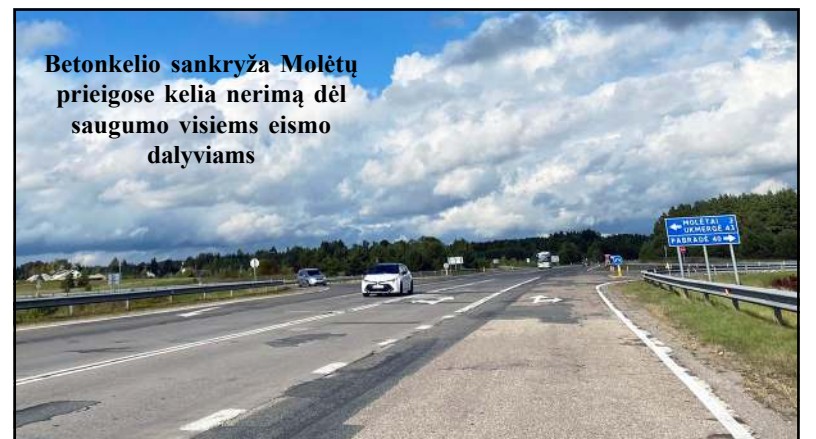
Betonkelio sankryža Molėtų priegose kelia nerimą dėl saugumo visiems eismo dalyviams

tvirtintų Lietuvos Respublikos susisiekimo ministro 2020 m. rugpjūčio 28 d. įsakymu Nr. 3-487, (toliau - Taisyklės) reikalavimus. Pagal šią Taisyklių reikalavimus el. laiške minimoje vietoje pėsčiųjų perėja (pėsčiųjų perėjimo per kelią ar gatvę vieta, pažymėta nurodomaisiais kelio ženklais „Pėsčiųjų perėja“ ir ženklavimo linijomis arba tik nurodomaisiais kelio ženklais „Pėsčiųjų perėja“) negali būti įrengta, nes kelio ruožas nėra gyvenvietėje (pagal Taisyklių 23.1 papunktį), tai yra užmiesčio kelio ruožas. Tokia nuostata Taisyklė-