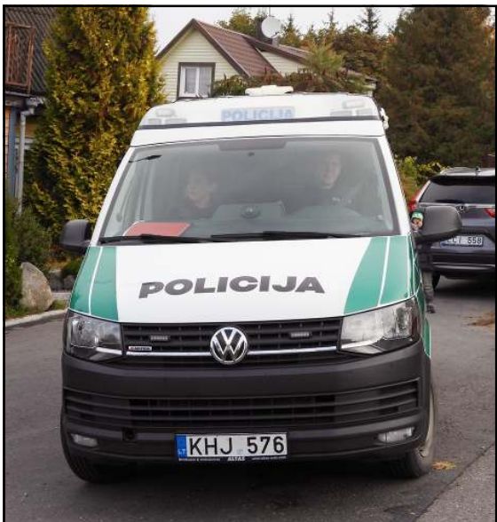
Per praėjusią savaitę pareigūnai reagavo į 60 iškvietsių

Per praėjusią savaitę buvo pradėti 8 ikiteisminiai tyrimai, o tai reiškia, kad į šiuos įvykius reagavę pareigūnai medžiagą perdavė Veiklos skyriui, kur įvykiai tiriami dažniausiai jau