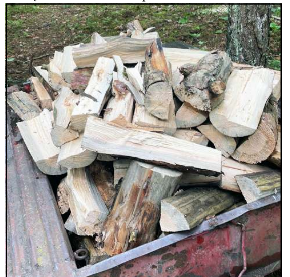
Kompensaciją gali gauti būstą šildantys ir malkomis

dų kompensacija teikiama nepriklausomai nuo šildymo būdo. Tai reiškia, kad kompensaciją gali gauti tiek būstą šildantys centralizuotai, tiek kitos rūšies kuru: malkomis, dujomis, elektra ir pan.