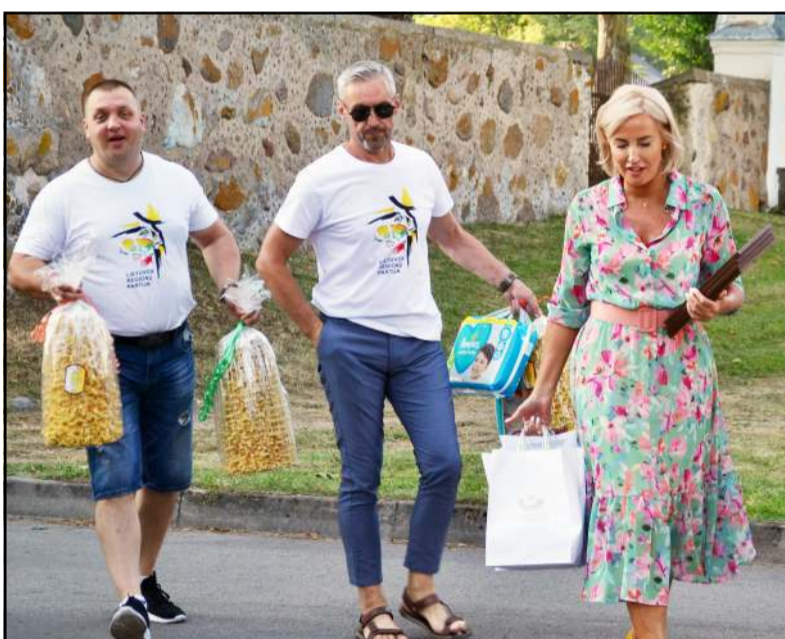
Naujas lošėjas rinkimuose- Lietuvos regionų partija