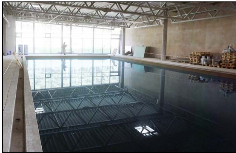
Hydroizoliacija patikrinta, baseinas pradėtas klijuoti plytelėmis