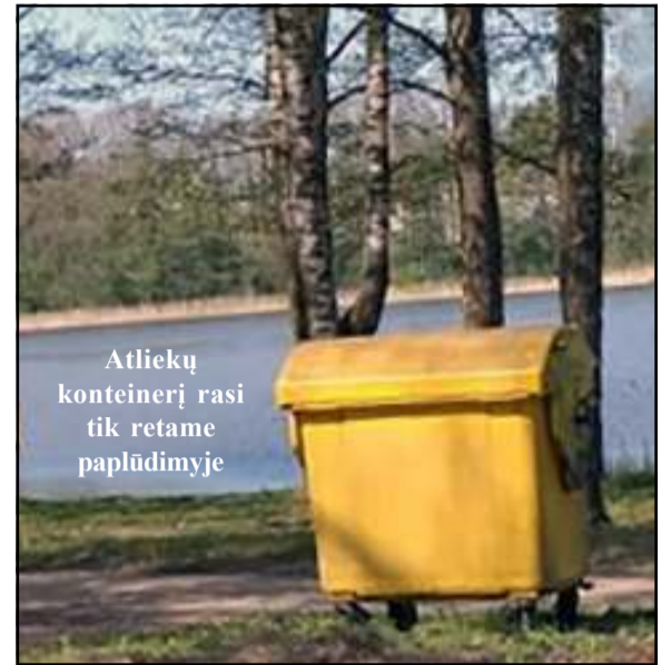
Atliekų konteinerį rasi tik retame paplūdimyje

poilsiautojų srautą aplankantį mūsų kraštą, ko gero, uždavinys gero kai viršijantis vietinių, kad ir labai aktyvių, bendruomenių jėgas.