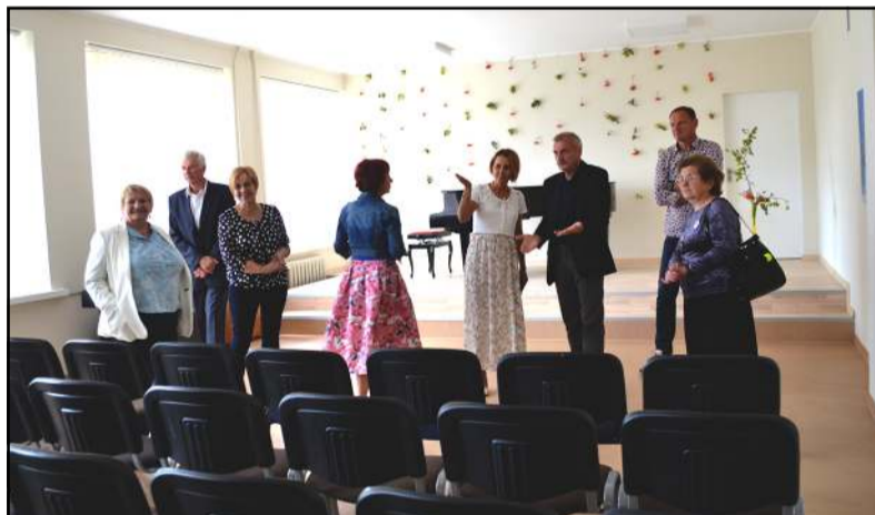
Tokios akustikos salėje kiekvieno mokytojo širdis dainuoja