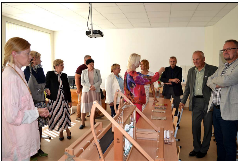
Naujomis erdvėmis pasidžiaugti sukviesti visi rajono ugdymo įstaigų vadovai

Ilgus metus Molėtų menų mokykla, besiblaškusi po miesto darželius, planuota įkurdinti tai vienur, tai kitur, netgi padarant investicinį projektą, pagaliau turėjo iškurti buvusiuose globos namuose, šiemet rugsėjo pirmąją pasitiko naujose, erdviuose, komfortiškoje patalpose ir - nauju adresu Jaunimo gatvėje, Molėtuose. Rajono valdžiai ieškojus sprendimo, kaip išspręsti Molėtų menų mokyklos patalpų stygiaus ir remonto problemą, galop priėmus sprendimą šią ugdymo įstaigą įkurdinti viename iš Molėtų progimnazijos korpusų, remonto darbus už daugiausiai negu 230 tūkst. eurų atliko P. Leišio individuali įmonė. Menų mokykla suremontuotas ir perduotas visas trijų aukštų Molėtų progimnazijos turėtas pastatas, kurio viename aukšte jau veikė menų mokyklos Dailės skyrius, II aukšte vykdavo pamokos progimnazistams,