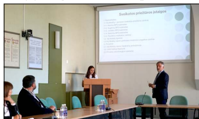
Susitikimo Molėtuose metu PSO ekspertams pristatyta sveikatos įstaigų sistema mūsų rajone

jams laiku gauti kokybiškas sveikatos priežiūros paslaugas... Susitikimo metu buvo peržiūrėti ir įvertinti siūlomi pokyčiai, nustatyti galimi sveikatos priežiūros įstaigų tinklo re-