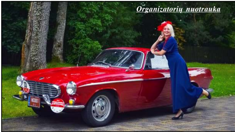
Ankstesnis ralis startavo prie Alantos dvaro rūmų