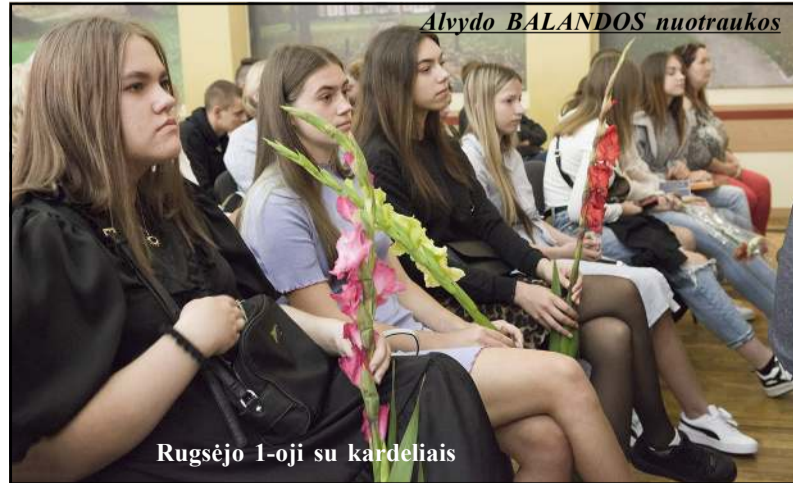
Rugsėjo 1-oji su kardeliais