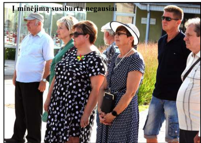
Į minėjimą susiburta negausiai

padėjus gėlių puokštę, vakare burta savivaldybės aikštėje – prisiminti, padėkoti, pagerbti, pakviesti išlikti laisvais ir mokėti tai įvertinti. Į