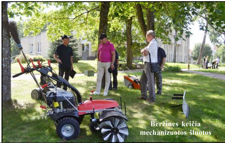
Beržines keičia mechanizuotos šluotos