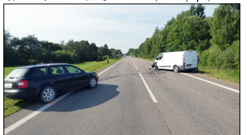
Eismo įvykis betonkelyje fiksuotas policijos bepiločio orlaivio pagalba

moterį jos sugyventinis tampė už plaukų. Nuvykus rasti ir vyras, ir moteris stipriai neblaivūs, tad įvykių aplinkybių aiškinimasis buvo ap sunkintas. Vis tik išvykta smurto faktui nepasitvirtinus bei įsitikinus, kad sugyventiniai vienas kitam pretenzijų neturi. Apie vidurnaktį „dragas“