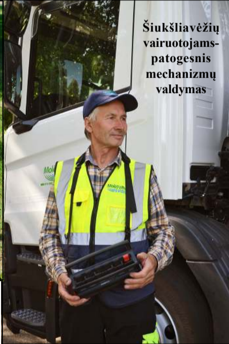
Šiukšliavėžių vairuotojams patogesnis mechanizmo valdymas