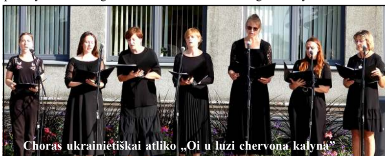
Choras ukrainiečių kalba atliko „Oi u luzi chervona kalyna“