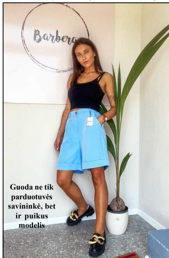
Guoda ne tik parduotuvės savininkė, bet ir puikus modelis

skatinu tą kitoniškumą rinktis ir savo klientes. O prekės atkeliauja iš įvairių vietų. Šiuo metu dirbu ir su Lietuvos, ir užsienio tiekėjais. Planuoju bendradarbiauti su ukrainiečių prekybininkais... Kadangi mano ji parduotuvė dar tik pradėjo savo kelią, visą dėmesį sutelkiu į jos pačios tobulinimą, informacijos sklai-