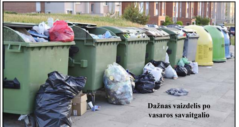
Dažnas vaizdelis po vasaros savaitgalio

Kaip keisis infrastruktūra? Jau patvirtintas Valstybinis atliekų prevencijos ir tvarkymo planas įpareigoja iki 2030 m. sumažinti sąvartynuose šalinamų komunalinių atliekų kiekį,