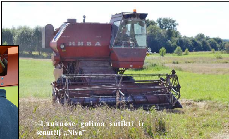
Laukuose galima sutikti ir senutėlį „Niva“

drašiūnų kaimų sankirtoje žiemiųjų javų lauke besidarbavusio kombaino savininkui priekaištų dėl turimo gesintuvo neturėta, o apžiūrėjus variklio skyrių, nustebino pavyzdinė jo švara. Joniškėje su penkių dešimčių senumo kombainu besidarbavusiam ūkininkui, prasitarusiam, kad derlius nedžiugina, o prieš savaitę jo laukai dar ir plaukė nuo gau-