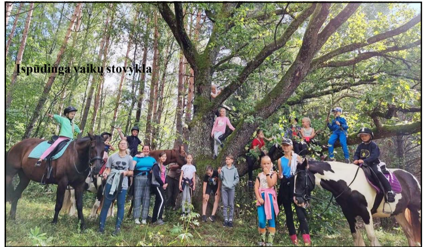
Ispūdinga vaikų stovykla