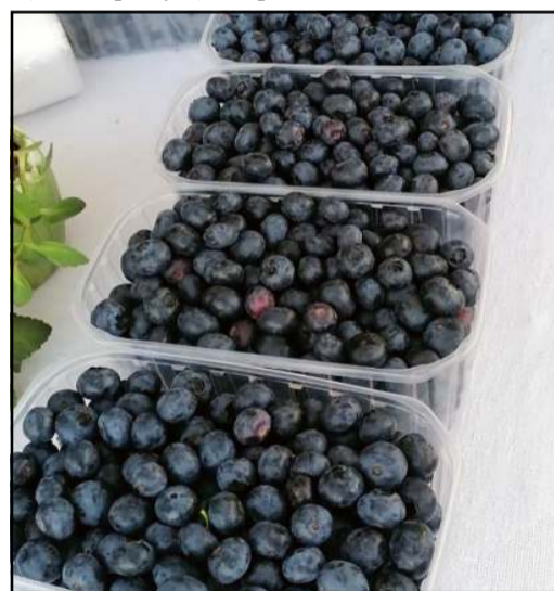
Pasibaigus braškių sezonui, ant prekybinių stalų – šilauogės

lauogių sezonas ir, tarkime, jeigu, perkant šilauogės, nepažymėtas ūkis, perkėjas turi teisę paprašyti dokumento, iš kokie ūkio uogos pirktos, ar tikrai toks ūkininkas yra. Kitaip sakant, perkėjas turi žinoti, kieno uogas ar vaisius perka. O parduodant braškes turi būti nurodyta klasė, veislė, ūkis, pavadinimas. Apibendrinant, ir vietoje