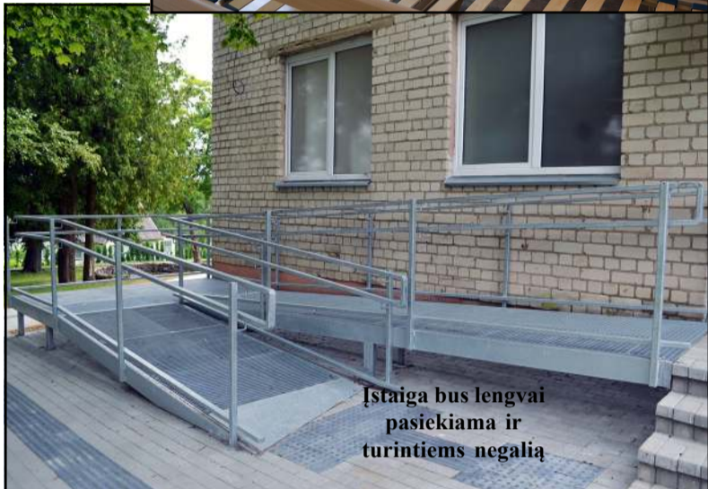
Įstaiga bus lengvai pasiekama ir turintiems negalia