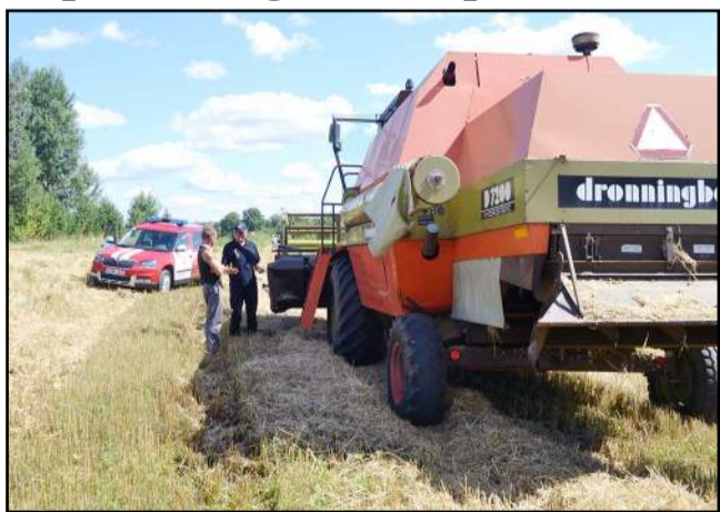
Ugniagesiai gelbėtojai tikrino javapjūtės techniką