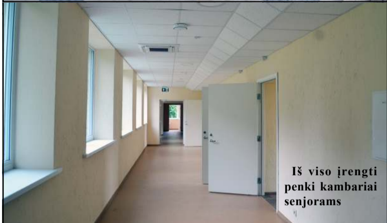
Iš viso įrengti penki kambariai senjorams

ramioje vietoje, medžių apsuptyje netoli Alaušų ežero ir greta Stiklo muziejaus bei paveikslų galerijos. Priminsime, kad Molėtų rajone viešajai įstaigai „Kaimynystės namai“ priklausantys socialinės globos na-