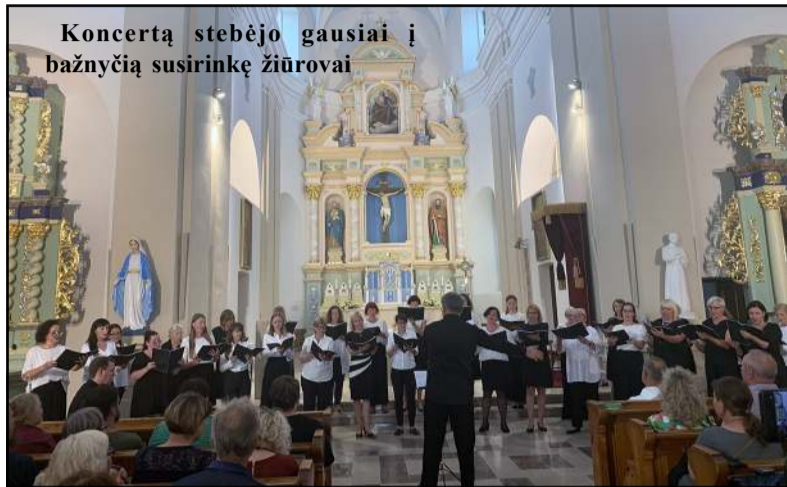
Koncertą stebėjo gausiai į bažnyčią susirinkę žiūrovai

pe, prasidėjus geopolitinei katastrofai, dalyvavo gastrolėse užsienyje. Išgirdus tragiškas naujienas, choro merginos pasiliko, o vaikiniai išvyko ginti tėvynės. Kartu su Lietuvos chorų vadovų Vasaros Akademija ji atliko 2 kūrinus.