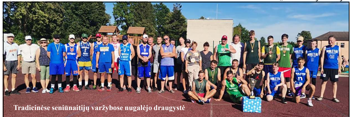
Tradicinėse seniūnaitijų varžybose nugalėjo draugystė