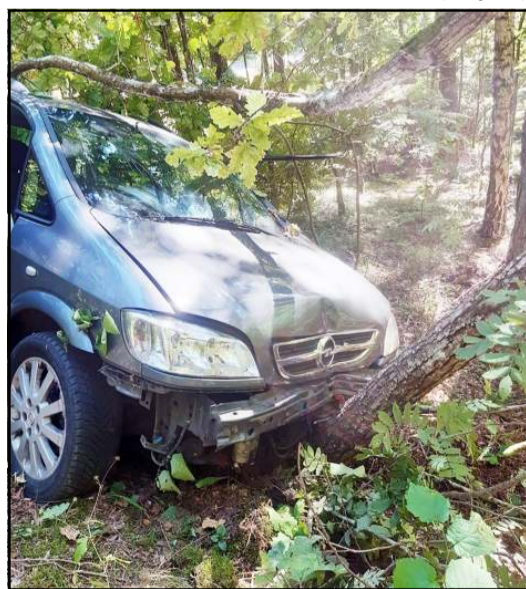
Neblaivų vairuotoją Dubingių s. sustabdė medis

Ilgasis ir karštas savaitgalis sumušė visus šios vasaros rekordus policijos įvykių suvestinėse, kuriose užregistruota 137 pranešimai, pradėta net 11 ikiteisminių tyrimų, 20 kartų vykta dėl muzikos ir triukšmo, 4 asmenys išgabenti į psichiatrijos ligoninę. Neblaivių asmenų pranešimai registruoti jau dešimtimis, kaip ir neblaivūs vairuotojai, siautėję rajono keliuose. Tik savaitės pradžia sąlyginai buvo ramesnė – vykta dėl galimai automobiliu išlaužtų vartų į Tiesos gatvę, Molėtuose - pradėta administracinio nusižengimo teise. Iš Joniškių s. gautas pareiškimas dėl išgriaautos sandėlio sienos, bet