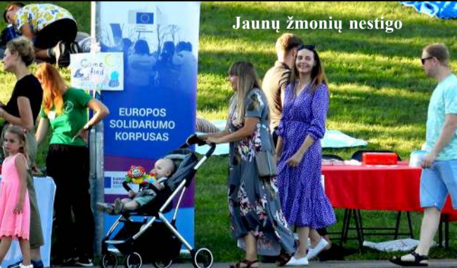
Jaunų žmonių nestigo