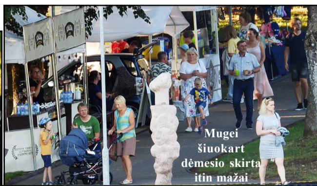
Mugė šiuokart dėmesio skirta itin mažai