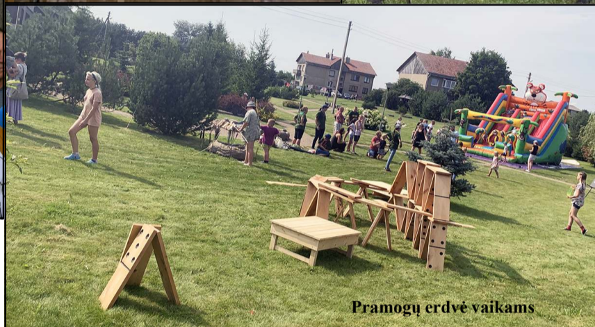
Pramogų erdvė vaikams