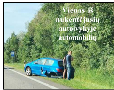
Vienas iš nukentėjusių autoįvykyje automobilių

Ankstų antradienio rytą magistraliniame kelyje Vilnius - Utena, ties Smailių kaimu, įvyko eismo įvykis, į kurį pateko keturi automobiliai. Masinė avarija įvyko apie pusę aštunto ryto, kuomet, pirminiais duomenimis, nuo Vilniaus link Utenos važiuosio automobilio "Audi" vairuotoja - Utenos rajono gyventoja (g. 1963 m.) (blaivi) užmigo... Auto-