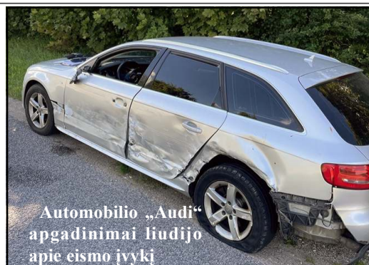
Automobilio „Audi“ apgadinimai liudijo apie eismo įvykį