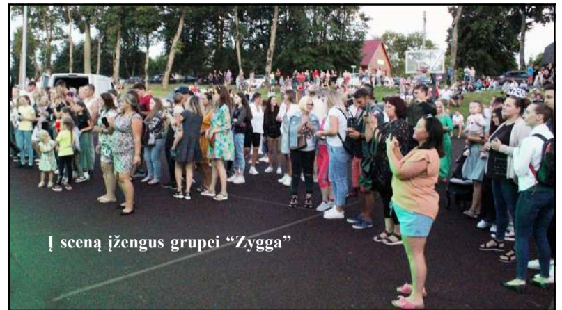
Į sceną įžengus grupei „Zygga“

Artėjant pavakarei, pradėta rinktis Videniškių sambūrių erdvėje, šalia kurios spėriai įsikūrė Molėtų priešgaisrinės gelbėjimo tarnybos komanda