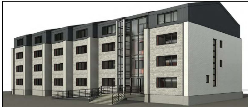
Tokia pateikiama atnaujinto pastato vizualizacija

kaip ir bet kokiais tektais aprašomos. Jeigu prisimenant jo priešistorę, statiniui dar anos kadencijos taryba planavo šviesią ateitį, jį prijungiant prie anuomet dar besikū-