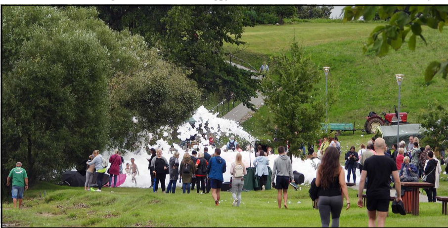
Rajono renginių kraitelę atidarys balninkiečiai, tradicinę Balninkų miestelio šventę pradėsiantys rugpjūčio 6 dieną

Žolinių šventės Molėtų bažnyčioje 18 d. koncertą surengs vasaros akademijos choro studija, o renginį ves maestro Vytautas Miškinis. Baidantis rugpjūčiui Molėtų Vasaros estradoje pirmą kartą bus surengtas Lietuvos nacionalinio operos ir baleto teatro simfoninio orkestro ir