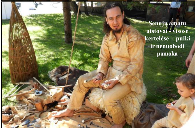
Senųjų amatų atstovai - visose kertelėse - puiki ir nenuobodi pamoka