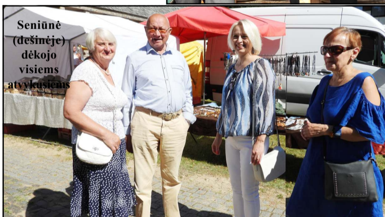
Seniūnė (dešinėje) dėkojo visiems atvykusiems

šventėje nestigo... Tuo tarpu muzikiniame fone aktyviai kiju mojavo senųjų amatų atstovas, siūlęs šventės momentą nusikaldinti, čia pat buvo pinamai krepšiai, skeliamas akmuo, o molėtiškės