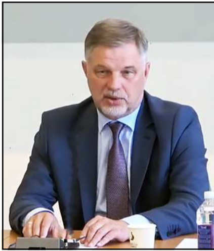
Meras turėjo pasiaiškinti dėl leidimų medžiams šventoriuje pjauti