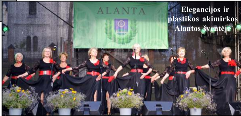
Elegancijos ir plastikos akimirkos Alantos šventėje