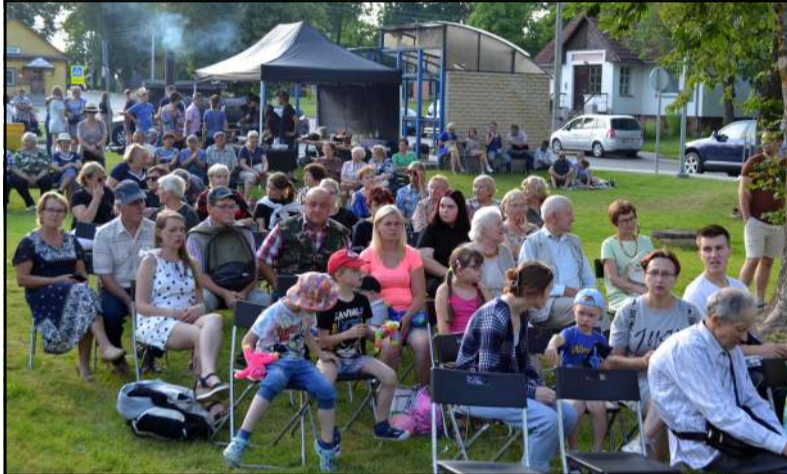
Alanta almėjo įprastu šiai liepą kasmet vykstančiai šventei bruzdesiu, linksmybėmis, nuotaika

Kaip visada puiki, įdomi, patraukli ir kupina judesio bei šeimyninio jaukumo įvyko devintoji Alantos krašto šeimų šventė. Smagu, kad renginys turi savo tradicijas ir tuo pačiu ieško naujų, tinkančių šventės tikslui - į bendrą būrį sukviesti šeimas, suburti žmones, mylinčius savo kraštą, jo istoriją... Gražia ir daug emocijų dovanojančia tradicija tapo draugystės bėgimas iš Alantos dvaro į Alantos turgaus aikštę, kurioje sutikus bėgikus tradiciškai prasideda šventinė diena - su mugės prekiautojais ir pačiomis įvairiausiomis pramogomis šeimai - vyko edukacijos, kariškių užsiėmimai, žaistas krepšinis, kunigaikščių Radvilų draugo-