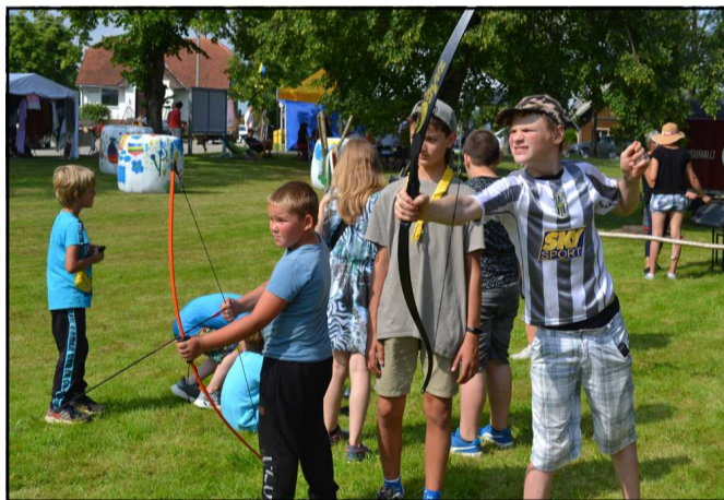
Pramogų ir dėmesio nestokoją jauniausieji Alantos krašto gyventojai