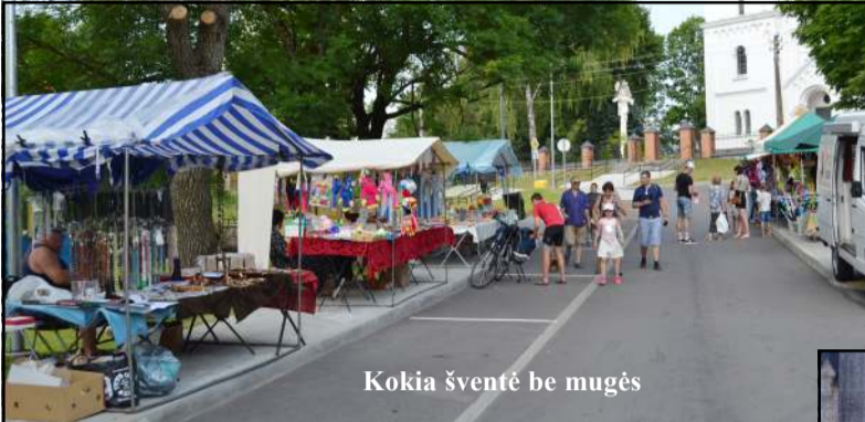
Kokia šventė be mugės