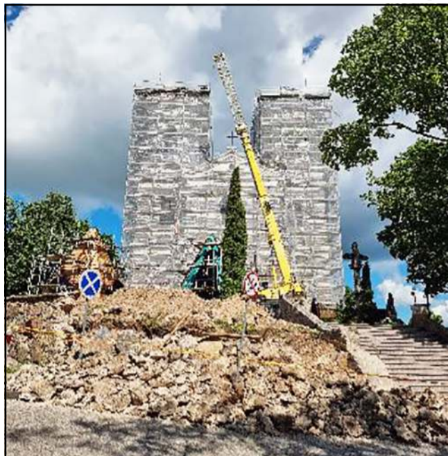
Pradėti demontuoti bažnyčios bokštai

se, P. Stolyfino name, Kauno Sobotre... Ar nejučias aukščio baimės, pa-