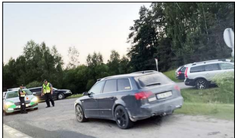
Policijos pareigūnams teko stebėti ypatingai didelius srautus eismo dalyvių prie Vasaros estrados vakarinėje miesto šventės dalyje

dezininkai, vyras nusiramino... Molėtiškė pareigūnūs išsikvietė dėl lietaus vandens, kuris teka iš aukščiau esančios namų valdos ir plauna jos namo pamatus, dėl ko trūkinėja namo sienos, yra pamatai. Nestandartinio atvejo sprendimo ieškoti patartai kreipiantis į statybų inspekciją... Molėtiškis vaikas į pareigūnūs kreipėsi dėl apgavystės perkant internetu, kuomet sumokėjo pinigų, bet prekių iš pardavėjo negavo. Luokesos s. gyventojas, panašu, kad irgi susidūrė su sukčiumi, kuris