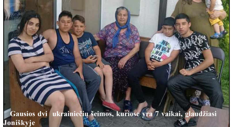
Gausios dvi ukrainiečių šeimos, kuriose yra 7 vaikai, glaudžiasi Joniškyje

TURITE NAUJIENŲ? Rašykite mums el. p. info@vilnis.lt. Draugaukime!