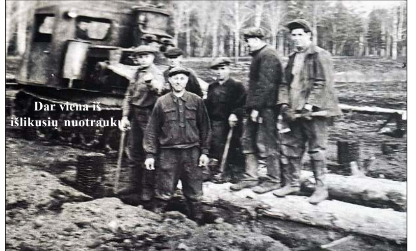
Dar viena iš likusių nuotraukų