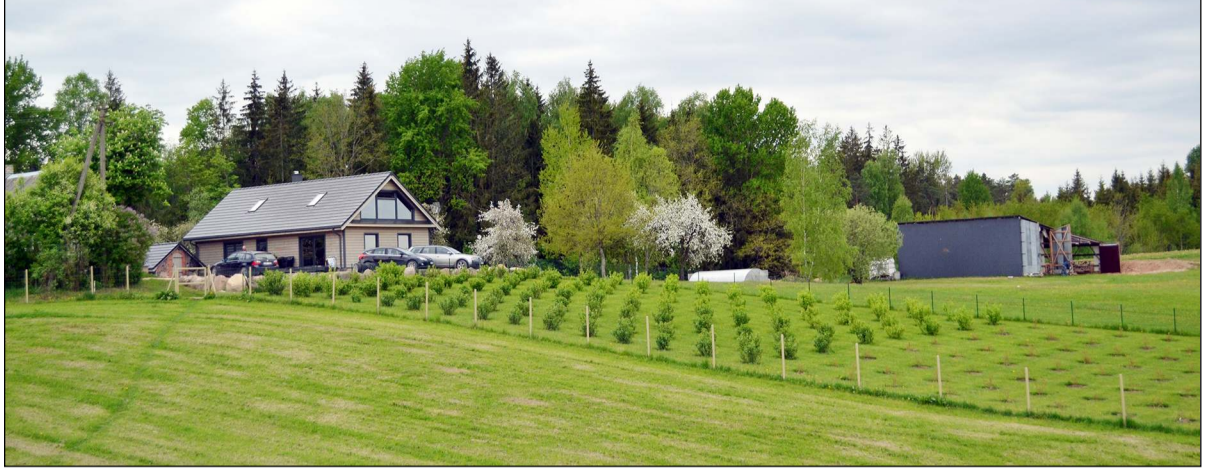
Žvilgnis į Alpakalnio sodybą Batėnų kaime