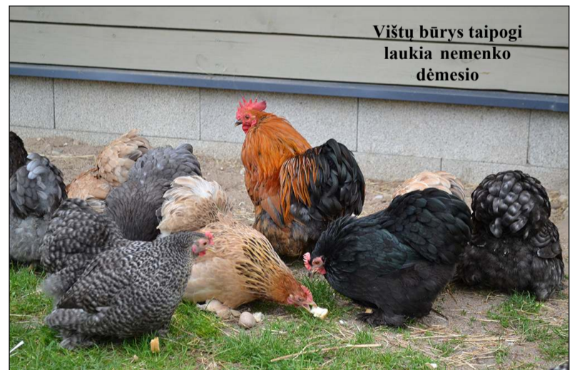
Vištų būrys taipogi laukia nemenko dėmesio