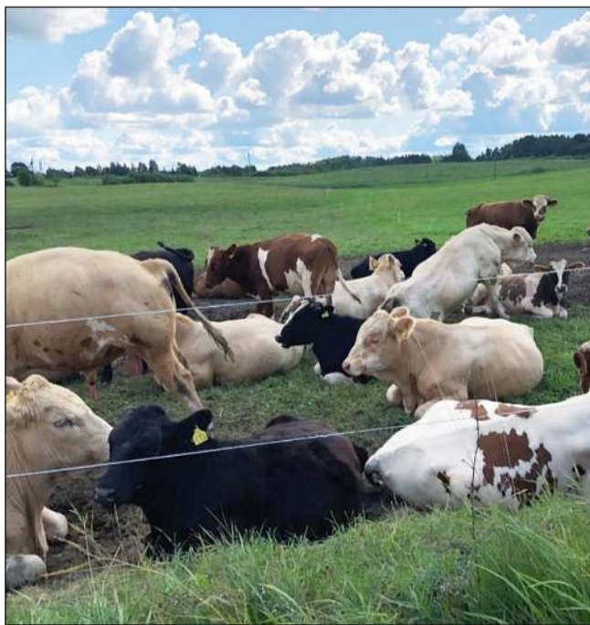
Ganiavos metu iš aptvarų ištrūkę gyvuliai – dažna problema ir Molėtų rajone

akutės - pareigūnai negalėjo išspręsti... Senolei patarė kreiptis į šeimos gydytoją dėl šių tik jai vienai matomų vaizdinių... Žinomu adresu Molėtuose skubėta dėl muštynių tarp dviejų vyriškių, pasakojusių, kad, pasirodo, jie mušėsi... draugiškai! Mat vartojant alkoholinius gėrimus vienas iš sugėrovų kitam draugiškai galva pylė į galvą ir ją praskėlė. Nukentėjusysis jokių pretenzijų sugėrovui neturėjo, o policiją iškviatė susijaudinęs... Irgi žinomu adresu į Kreiviškių kaimą (Dubingių s.) kviesti pareigūnai buvo