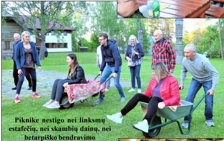
Piknike nestigo nei linksmų estafečių, nei skambių dainų, nei betarpiško bendravimo