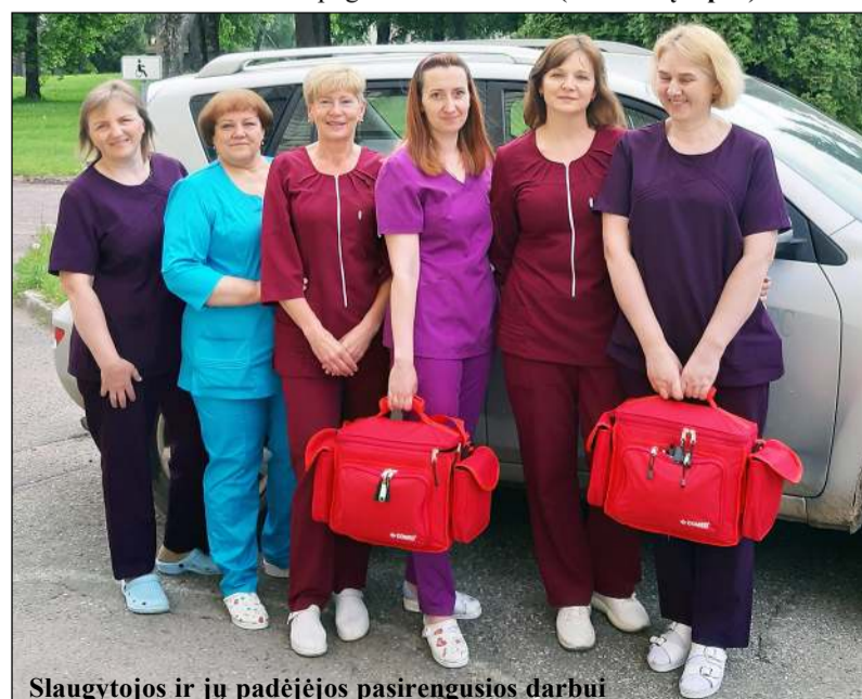
Slaugytojos ir jų padėjėjos pasirengusios darbui