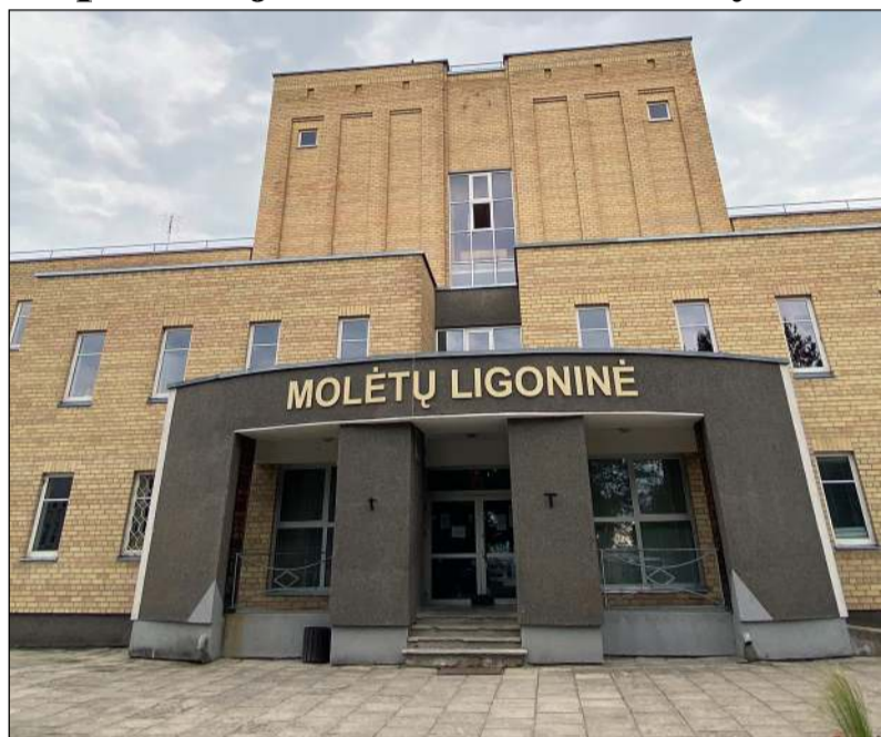
Siektas tikslas Molėtų ligoninę reformuoti į Santaros klinikų filialą, regis, tolsta, matyt, turėsime naują sveikatos centrą

Kiek tik bebuvo šalyje vykdoma sveikatos reformų, jos, regis, visos palietė mūsų rajoną ir mūsų sveikatos įstaigas – ypač ligoninę. Juk vieni pirmųjų netekome vaikų ligų, gimdymo, chirurgijos skyrių, kas kartą vis kažkas buvo siaurinama, mažinama ir žadama... kad žmogui bus geriau. Ir visada nelabai ką tokiose pertvarkose įtakoję steigėjų, kuriuo yra rajono taryba, nuomonės. Ji ir sprendimai reikalingi tuomet, kai reikia traukti iš skolų, o ligoninės istorijoje jų būta ir milijoninių, remontuoti, sykais – pradėti diskusiją ar bent jau pristatyti savo matymą. Tad šiuo kartu, pradėjus kalbėti apie dar vieną pertvarką, ne kartą rašėme, jog Molėtų ligoninė turi ambicijų tapti Santaros klinikų filialu, kuriuo teko pabūti koronaviruso metu ir įrodyti, jog partneriu gebama būti. Ta pačia linkme žvelgė ir rajono savivaldybė. Sveikatos apsaugos ministerijos prašyta, rajono savivaldybės taryba dar iki praėjusių metų pabaigos turėjo pateikti savo apsisprendimą dėl ligoninės ateities. Tuomet vienbalsiai sutarta teikti siūlymą dėl filialo, bet netrukus, „Vilniai“ paprašius ministerijos pozicijos dėl tokio apsisprendimo, paaiškėjo, kas ir bu-