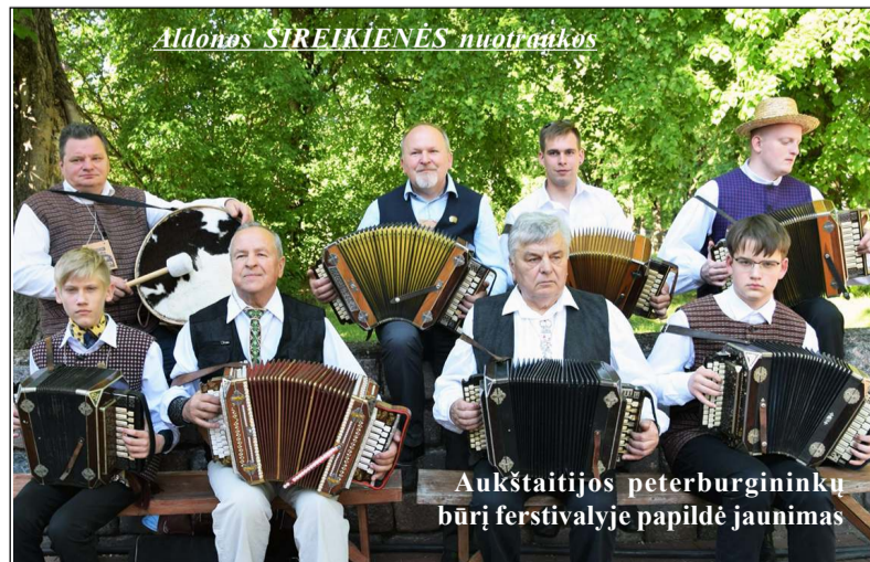
Aukštaitijos peterburgininkų būrį festivalyje papildė jaunimas