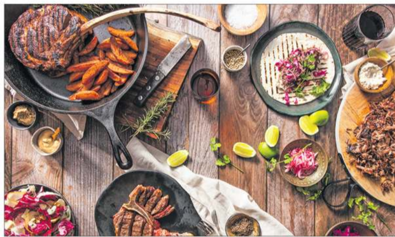
„Rokiškio mėsinė“ gali pasiūlyti didelį aukščiausios kokybės gaminių asortimentą, be to, jis nuolat pildomas naujais gaminiais. Šiai plėtrai pasitarnaus ir parama.