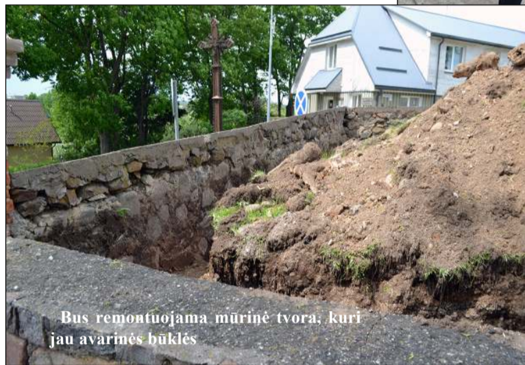
Bus remontuojama mūrinė tvora, kuri jau avarinės būklės