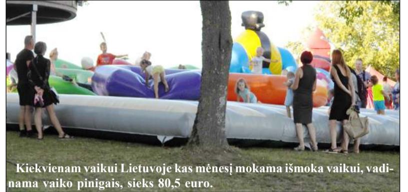
Kiekvienam vaikui Lietuvoje kas mėnesį mokama išmoka vaikui, vadinama vaiko pinigais, sieks 80,5 euro.

ro tarnybos kario vaikui. Jeigu vaiko tėtis, mama, įtėvis ar imotė yra pašaukti arba savanoriškai atlieka privalomąją pradinę karo tarnybą, tokio kario ar karės vaikui kas mėnesį bus mokama 69 eurų dydžio išmoka. Tuo atveju, jei pradinę karo tarnybą atlieka abu tėvai ar įtėviai, išmoka nėra didinama.