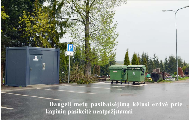
Daugelį metų pasibaisėjimą kėlusį erdvė prie kapinių pasikeitė neatpažįstamai

tvarkysime greta kapinių tvoros esantį parkelį bei planuojame nugriauti ir vadinamą sargo namelį, kuris jokios funkcijos nebeatlieka...“ Pasak Kęstučio Grainio, artimiausiu metu mieste turėtų atsirasti ir nuorodos, kurių dar stinga, į viešuosius tualetus, o pastarųjų stygiumi mies-