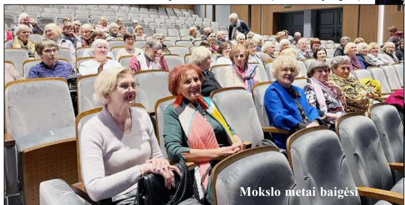
Mokslo metai baigėsi