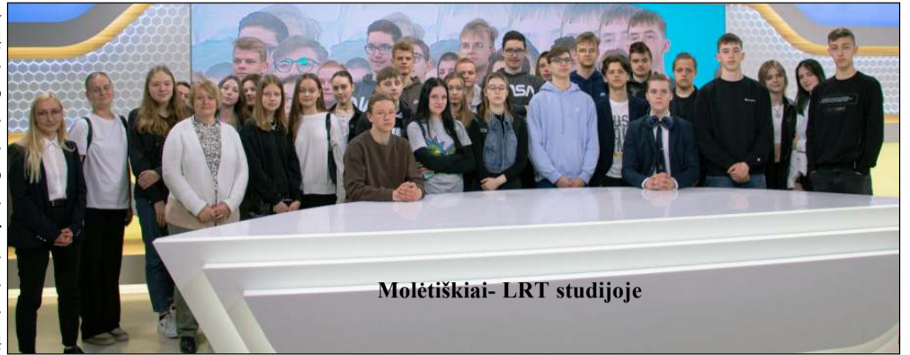
Molėtiškiai- LRT studijoje

Kaip informuoja Specialiųjų tyrimų tarnyba, jos inicijuoto konkurso „Skaidrumą kuriame kartu“ nominacijos „Skaidrumo skleidėja“ nugalėtojai lankėsi LRT ir Valstybės pažinimo centre. Šios nominacijos nugalėtoja tapo Molėtų